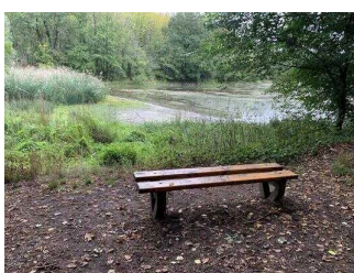
Wanderweg "Plötzkauer Auenwald"