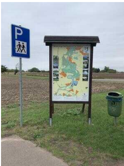
Wanderweg "Plötzkauer Auwald"