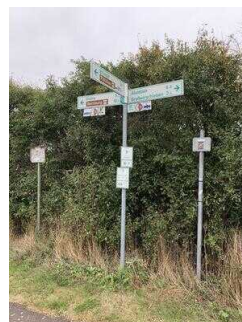
Visuell taktile Gestaltung