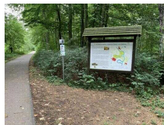
Wanderweg "Plötzkauer Auenwald"