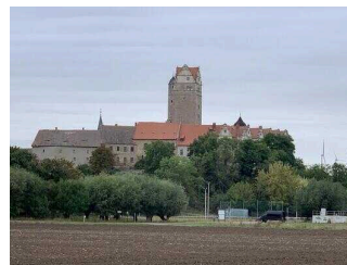
Wanderweg "Plötzkauer Auenwald"