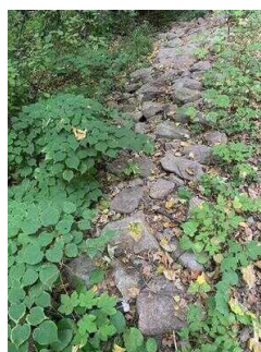
Wanderweg "Plötzkauer Auwald"