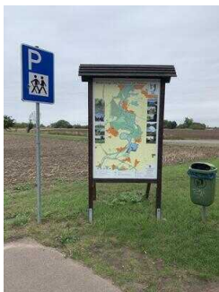
Wanderweg "Plötzkauer Auenwald"