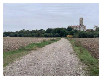
Wanderweg "Plötzkauer Auenwald"