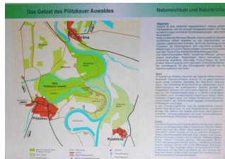
Wanderweg "Plötzkauer Auwald"