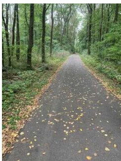
Wanderweg "Plötzkauer Auenwald"