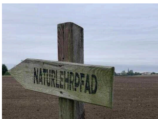
Visuell taktile Gestaltung