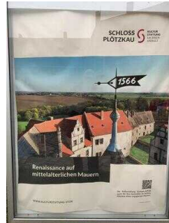
Mittelalterliche Burganlage Plötzkau