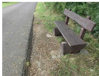
Wanderweg "Plötzkauer Auwald"