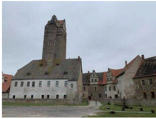
Mittelalterliche Burganlage Plötzkau