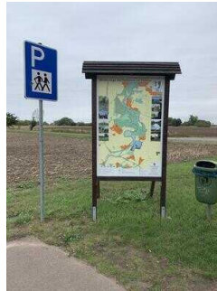
Wanderparkplatz am Schloss Plötzkau