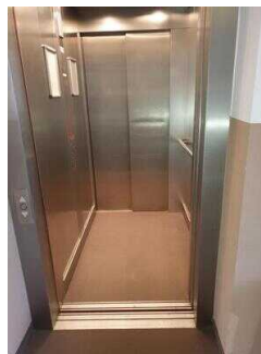
Aufzug 2 im Zimmerflügel Klink (EG-DG)