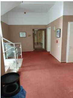
1. OG: Flurbereich WC/ Treppenhaus 1 Bock / Aufzug 1 / Bock 1