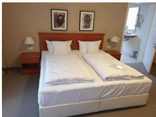
Wyndham Garden Quedlinburg Stadtschloss Hotel