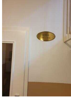
EG: Zimmerflur im Flügel Klink