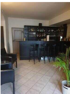
EG: Barbereich an der Lobby