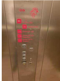
Aufzug 2 im Zimmerflügel Klink (EG-DG)