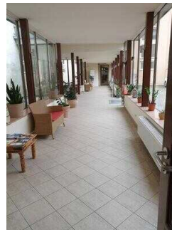
Wyndham Garden Quedlinburg Stadtschloss Hotel