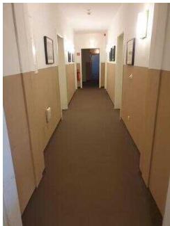
EG: Zimmerflur im Flügel Klink