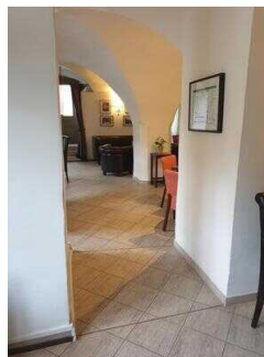
Durchgang zum Tresen