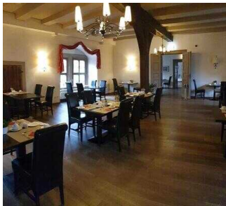
Wyndham Garden Quedlinburg Stadtschloss Hotel