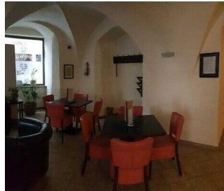
EG: Barbereich an der Lobby