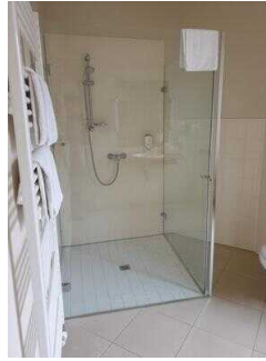
Zimmerflügel Klink, EG: Bad im Zimmer 103