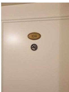
Zimmerflügel Klink, EG: Barrierefrei konzipiertes Zimmer 104