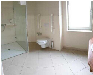
Zimmerflügel Klink, EG: Bad im Zimmer 103