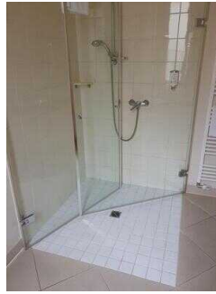
Zimmerflügel Klink, EG: Bad im Zimmer 104