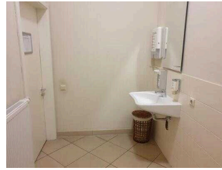
1. OG: Öffentliches WC für Menschen mit Behinderung