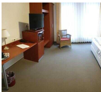
Zimmerflügel Klink, EG: Barrierefrei konzipiertes Zimmer 103