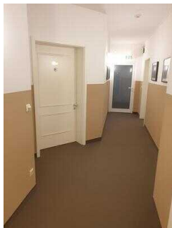
Zimmerflügel Klink, EG: Barrierefrei konzipiertes Zimmer 103