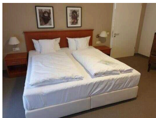
Zimmerflügel Klink, EG: Barrierefrei konzipiertes Zimmer 103