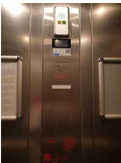
Aufzug 2 im Zimmerflügel Klink (EG-DG)