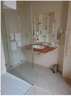
Zimmerflügel Klink, EG: Bad im Zimmer 104