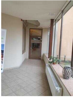
Tür zur Lobby/ Rezeption/Bar