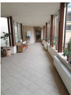
EG: Orangerie (Verbindungsweg im Eingangsbereich zwischen den Zimmerflügeln Bock und Klink und Rezeption)