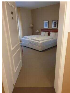
Zimmerflügel Klink, EG: Barrierefrei konzipiertes Zimmer 103