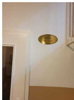
EG: Zimmerflur im Flügel Klink