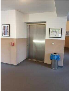
Aufzug 2 im Zimmerflügel Klink (EG-DG)