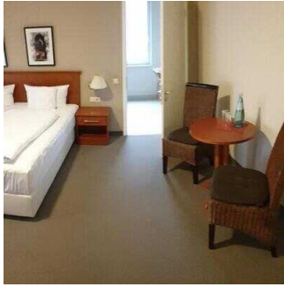
Zimmerflügel Klink, EG: Bad im Zimmer 103