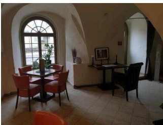
EG: Barbereich an der Lobby