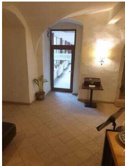
Tür zur Lobby/ Rezeption/Bar