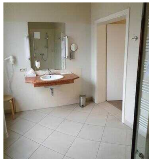
Zimmerflügel Klink, EG: Bad im Zimmer 103