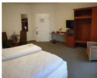
Zimmerflügel Klink, EG: Barrierefrei konzipiertes Zimmer 103