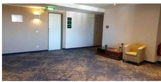
Bewegungsfläche vor dem Aufzug in den oberen Etagen