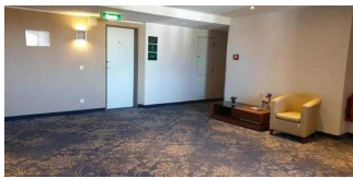
Bewegungsfläche vor dem Aufzug in den oberen Etagen