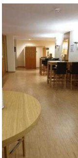
Weg von der Rezeption zum Restaurant / Tagungsraum Gerhard / Treppe zum UG