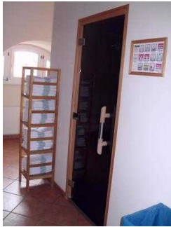
Tür zur Saunakabine