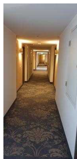
Weg vom Aufzug zu Zimmer 101