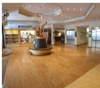
martas Hotel Lutherstadt Wittenberg