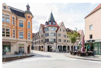
martas Hotel Lutherstadt Wittenberg