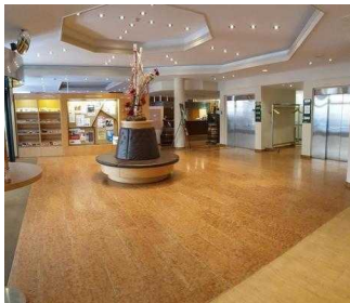
Weg von der Rezeption zum Restaurant / Tagungsraum Gerhard / Treppe zum UG