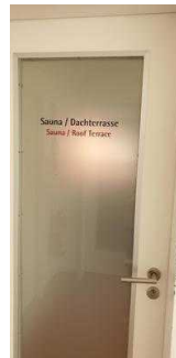
Tür zum Sauna-/ Ruhebereich