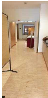
Weg von der Rezeption zum Restaurant / Tagungsraum Gerhard / Treppe zum UG