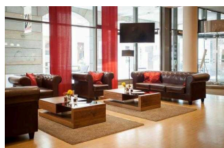
martas Hotel Lutherstadt Wittenberg