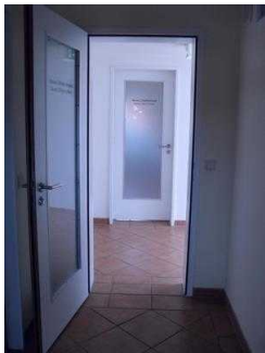
Blick aus dem Saunabereich Richtung Flur