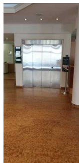
Aufzug im EG, rechts daneben befindet sich die Rezeption