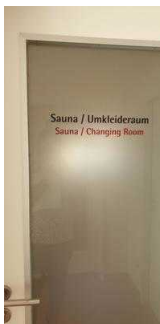
Tür zum Sauna-/ Ruhebereich