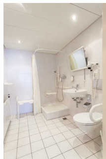
Badezimmer im Zimmer 101 Kerstin Klupsch

Es ist kein Alarmauslöser (Schnur, Knopf) vorhanden.