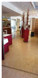
Weg von der Rezeption zum Restaurant / Tagungsraum Gerhard / Treppe zum UG