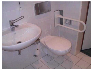
Badezimmer im Zimmer 101 Manuela Fischer