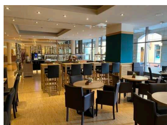
martas Hotel Lutherstadt Wittenberg