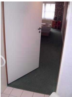
Zimmertür, Badezimmer im Zimmer 101 Manuela Fischer