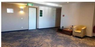
Bewegungsfläche vor dem Aufzug in den oberen Etagen