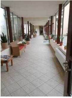
Wyndham Garden Quedlinburg Stadtschloss Hotel