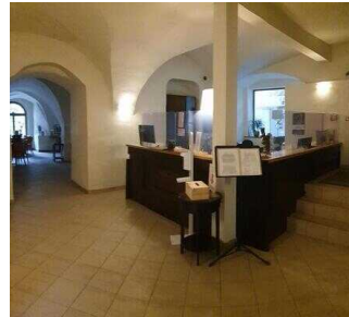
Wyndham Garden Quedlinburg Stadtschloss Hotel