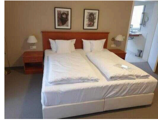
Wyndham Garden Quedlinburg Stadtschloss Hotel