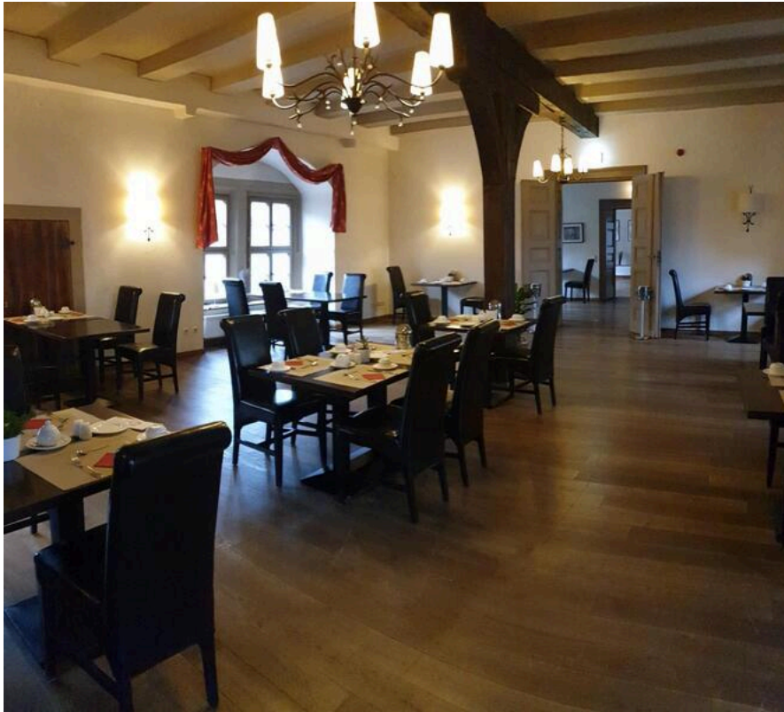
Wyndham Garden Quedlinburg Stadtschloss Hotel