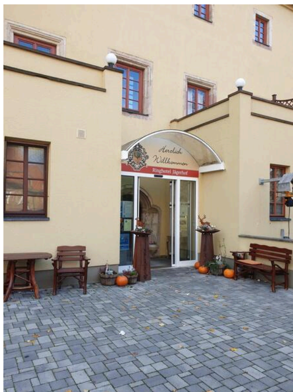
Ringhotel Jägerhof Weißenfels