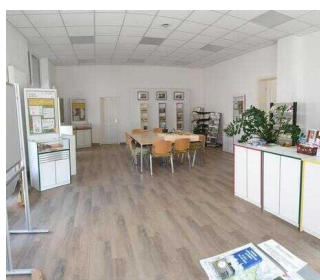
Kundenraum mit Infotresen