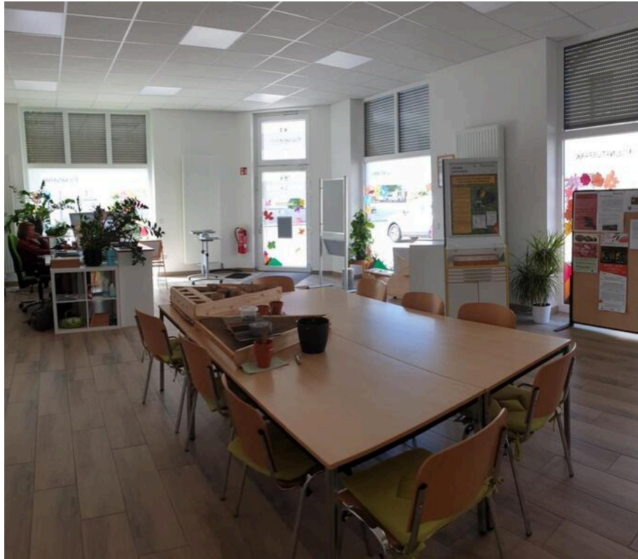
Naturpark Fläming Sachsen-Anhalt – Infozentrum in Coswig/Anhalt | ©Manuela Fischer