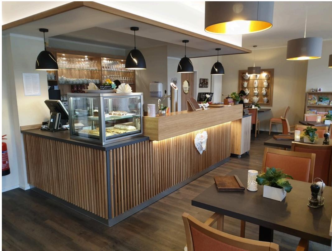
Café Argenta "GenussMomente" Wernigerode