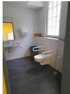
WC im UG