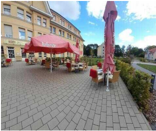
Café Argenta "GenussMomente" Wernigerode