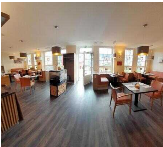
Café Argenta "GenussMomente" Wernigerode