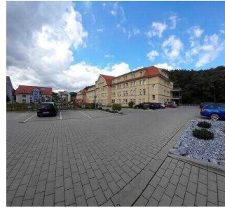
Café Argenta "GenussMomente" Wernigerode