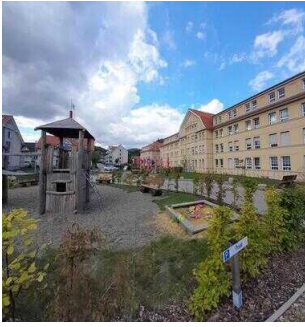
Café Argenta "GenussMomente" Wernigerode