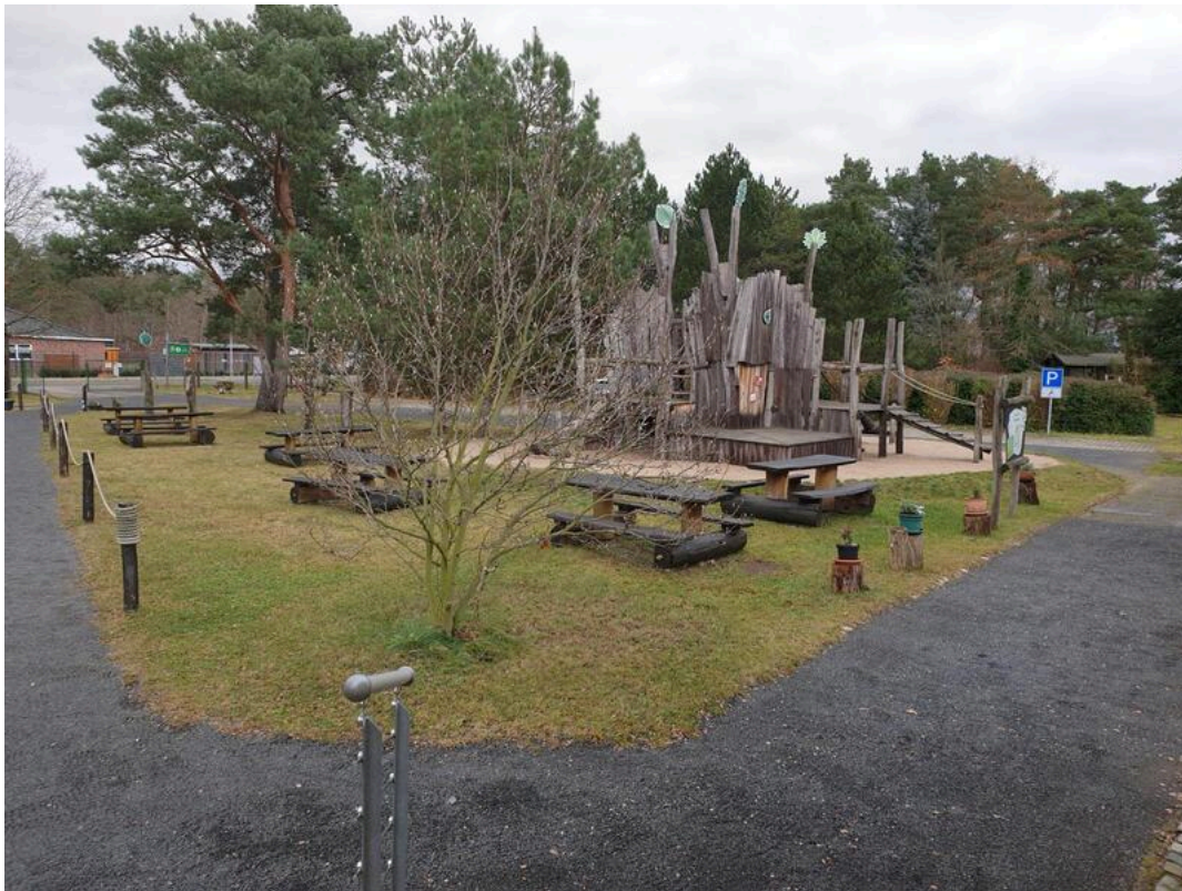
Das Waldhaus am Bergwitzsee