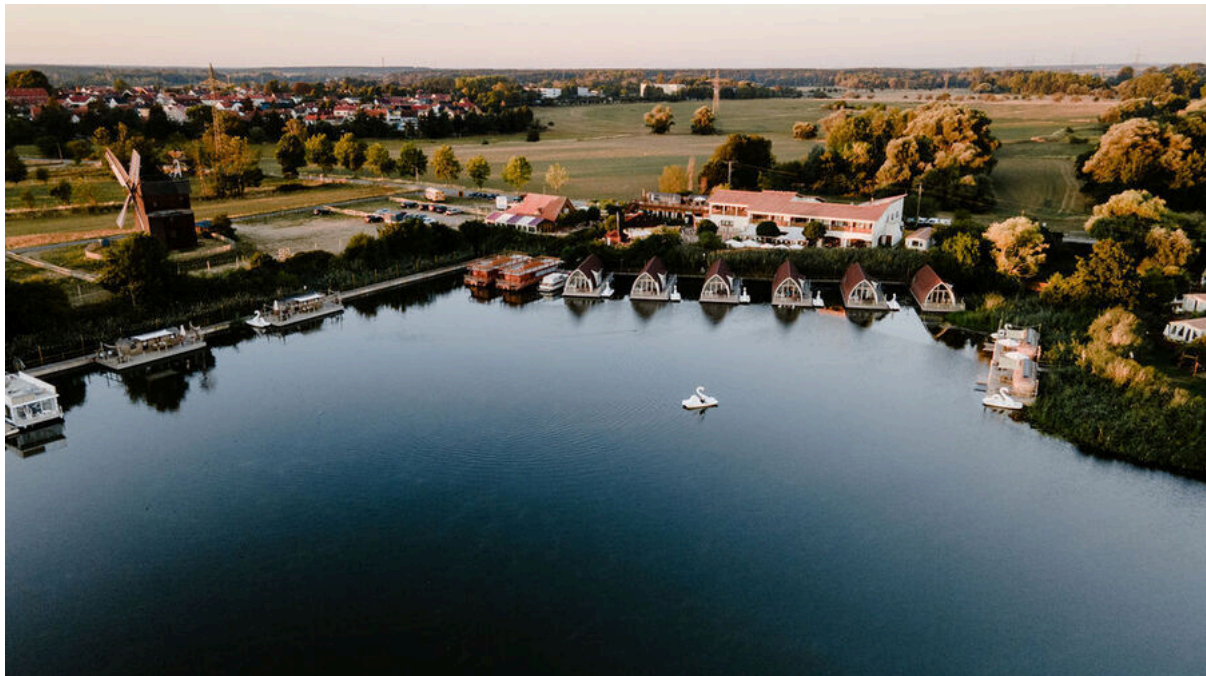
Dein Lieblingsplatz Parey