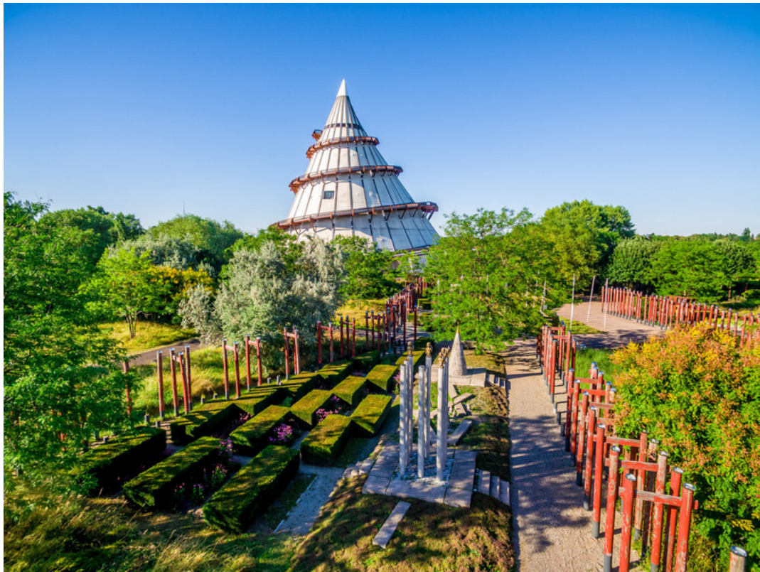
Elbauenpark Magdeburg | Andreas Lander