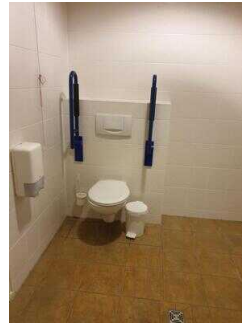
Haupthaus: Öffentliches WC