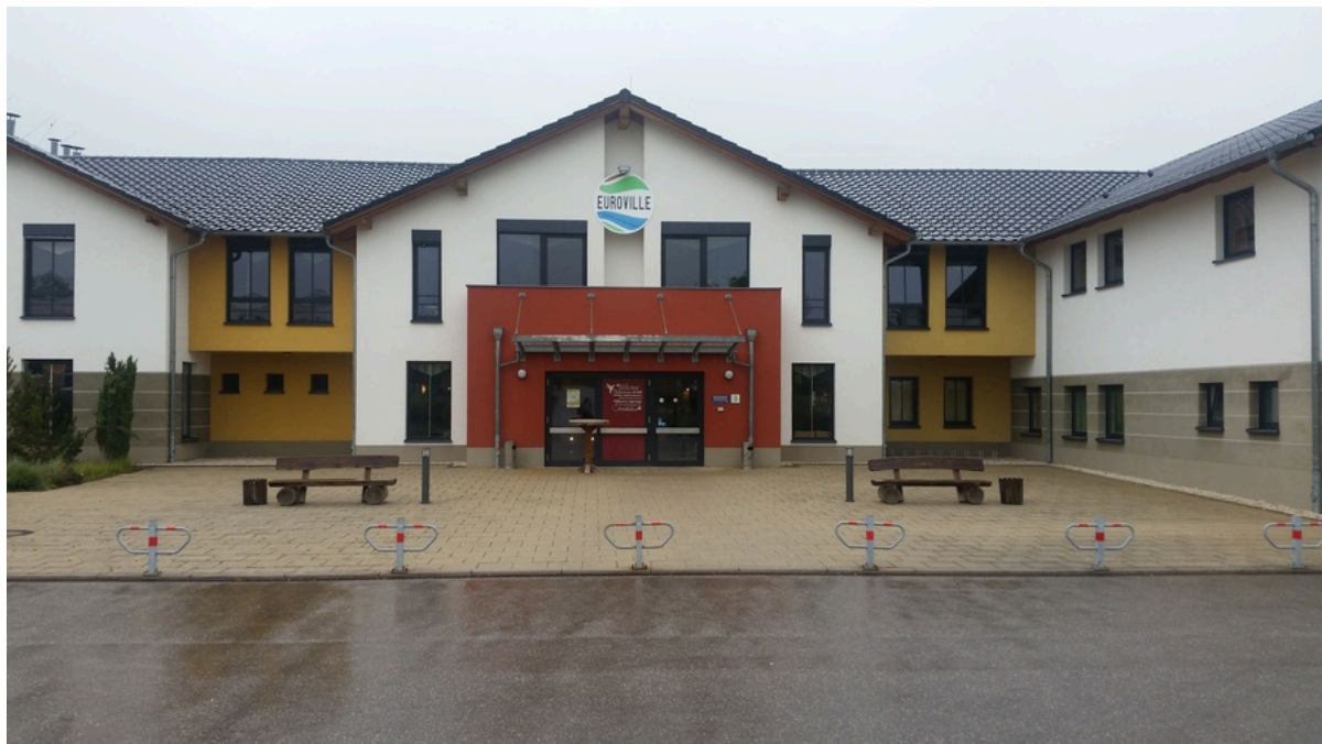
Eingang Haupthaus