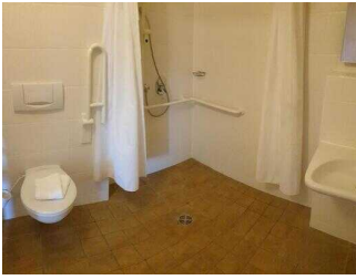
Haupthaus: Bad im Zimmer 36