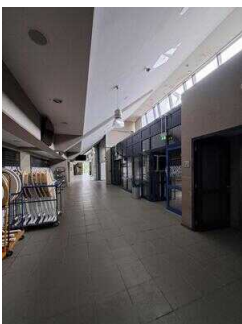
Wege in der Arena