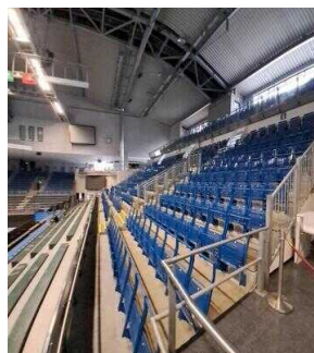
GETEC Arena Magdeburg