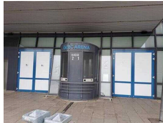
Eingänge mit Kasse