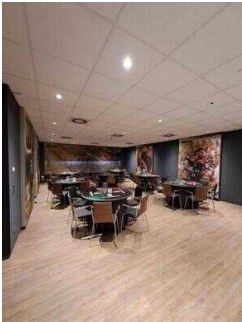
-2. Etage: GETEC Lounge