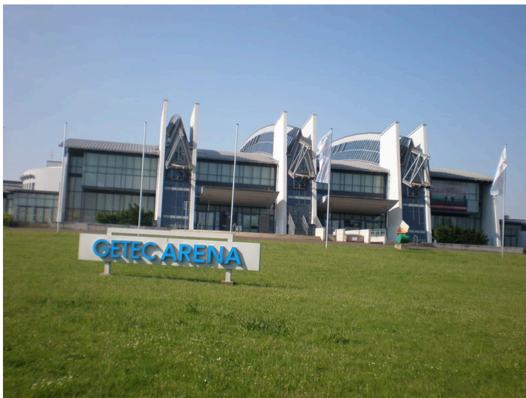
GETEC Arena Magdeburg