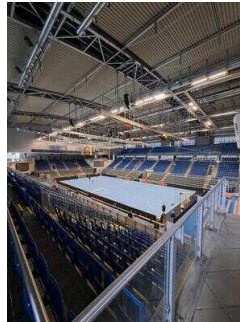
GETEC Arena Magdeburg