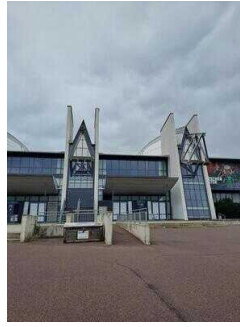
GETEC Arena Magdeburg