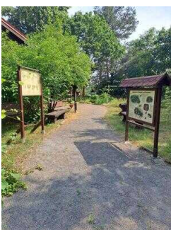
Außengelände mit Infotafeln und Sitzmöglichkeiten