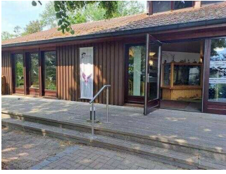
Haus am See Schlaitz – Haupteingang