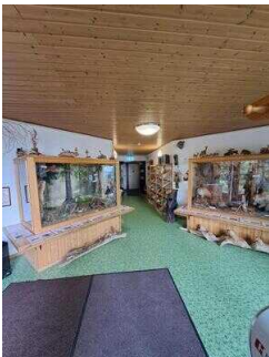
Ausstellungsvitrinen mit Blick auf den Nebeneingang