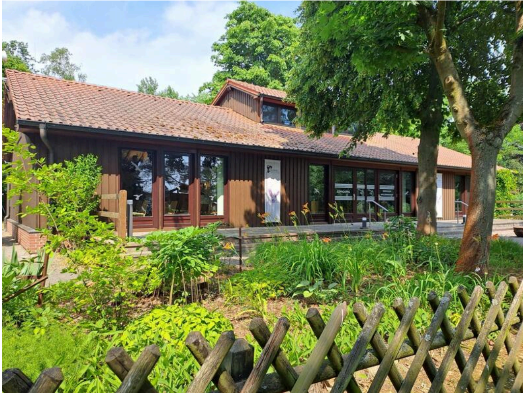
Haus am See Schlaitz – Informationszentrum für Umwelt und Naturschutz