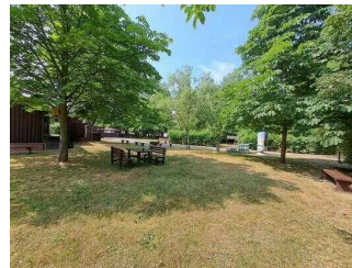
Außengelände mit Infotafeln und Sitzmöglichkeiten