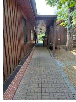
Rampe am Nebeneingang