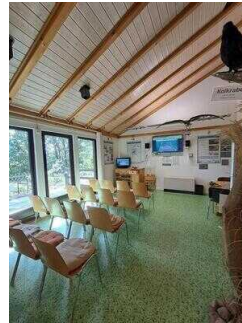
Ausstellungsraum mit Livecam in den Adlerhorst