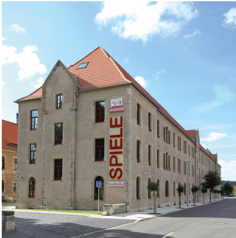
HaWoGe-Spiele-Magazin Halberstadt | HaWoGe mbH