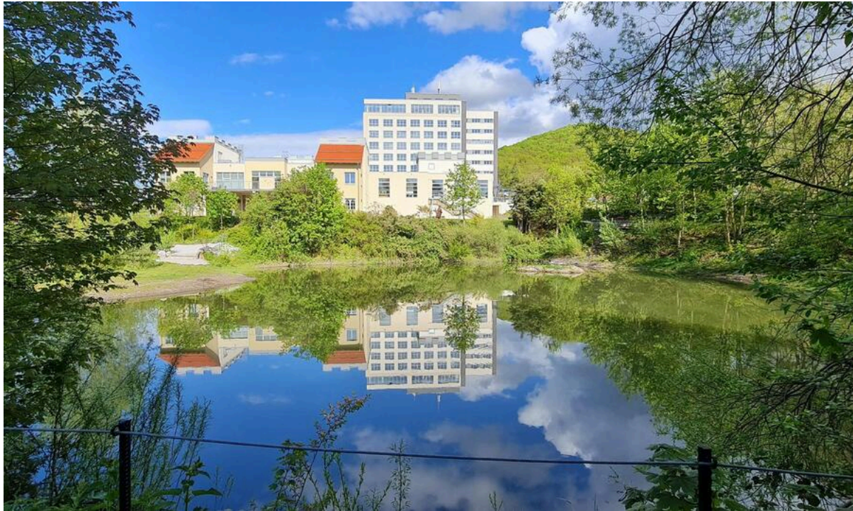
Hasseröder Burghotel