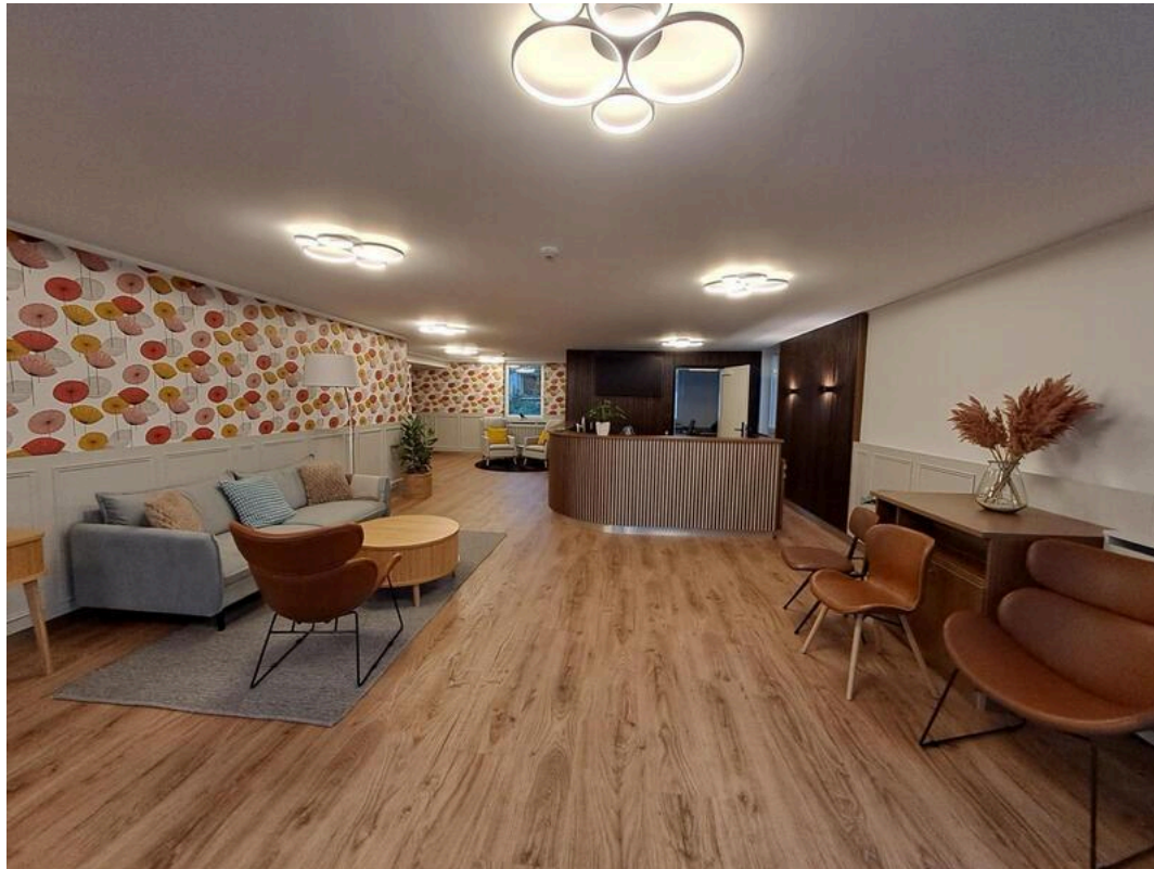
Hotel Elbebrücke – Rezeption | ©DSFT Berlin