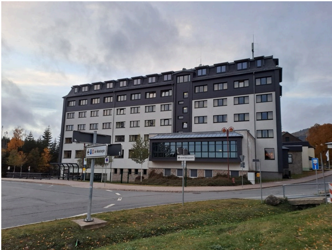
Jugendherberge Schierke