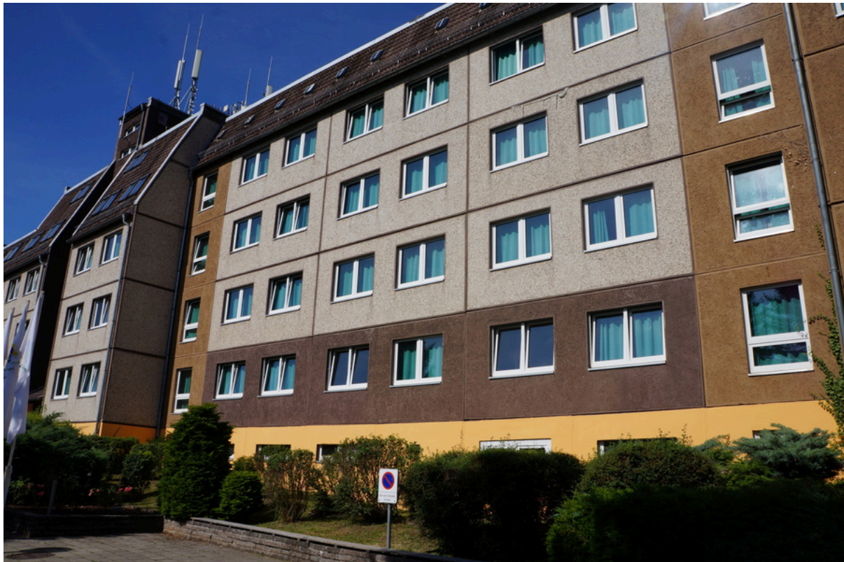
Jugendherberge Wernigerode