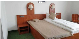
Gästehaus EG: Zimmer 10 mit Bad