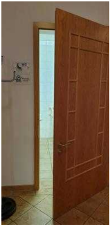
Hotel: Öffentliches WC für Menschen mit Behinderung