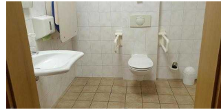
Hotel: Öffentliches WC für Menschen mit Behinderung