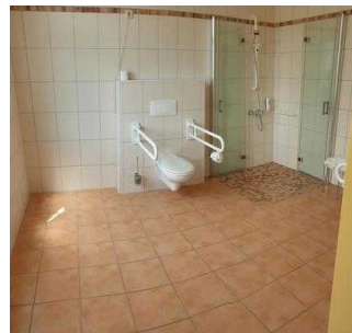
Gästehaus EG: Zimmer 10 mit Bad