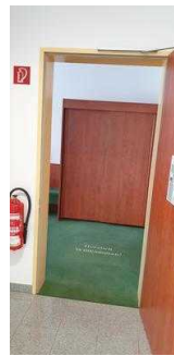
Gästehaus EG: Zimmer 10 mit Bad