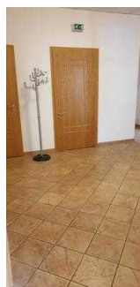
Hotel: Öffentliches WC für Menschen mit Behinderung