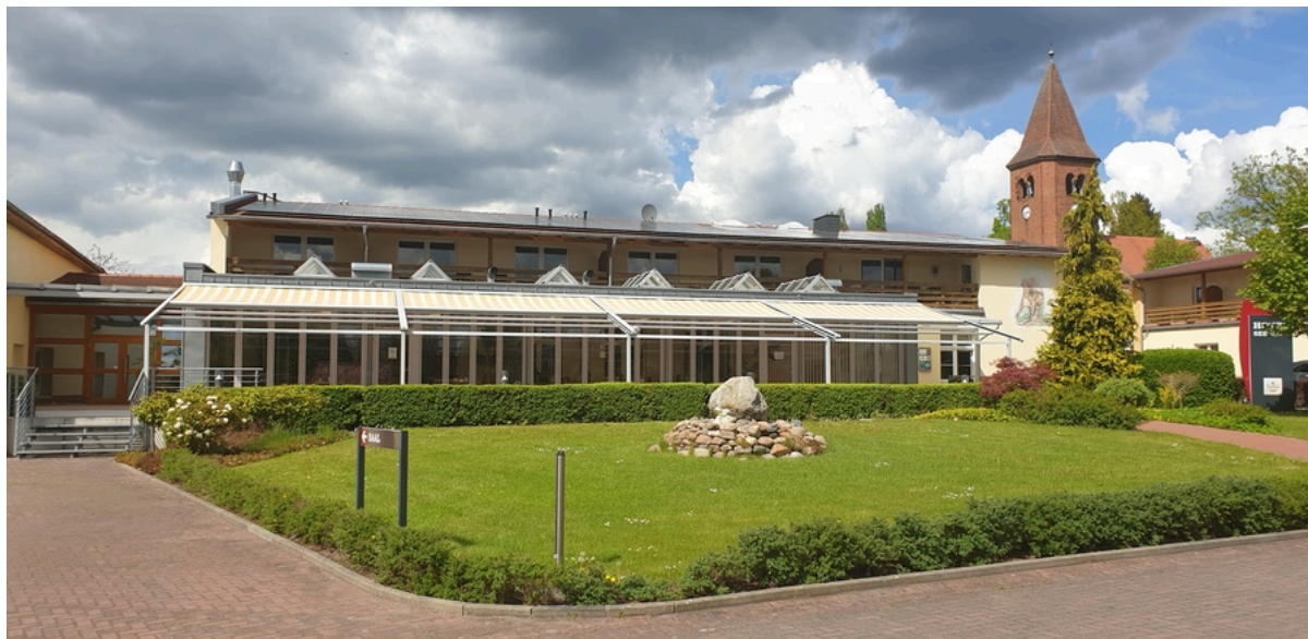
Land-gut-Hotel Seeblick Kietz | ©Ramona Wolf