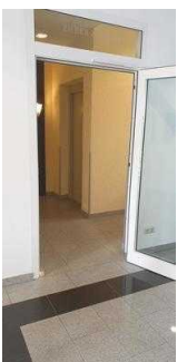
Gästehaus 1.OG: Zimmer 32 mit Bad