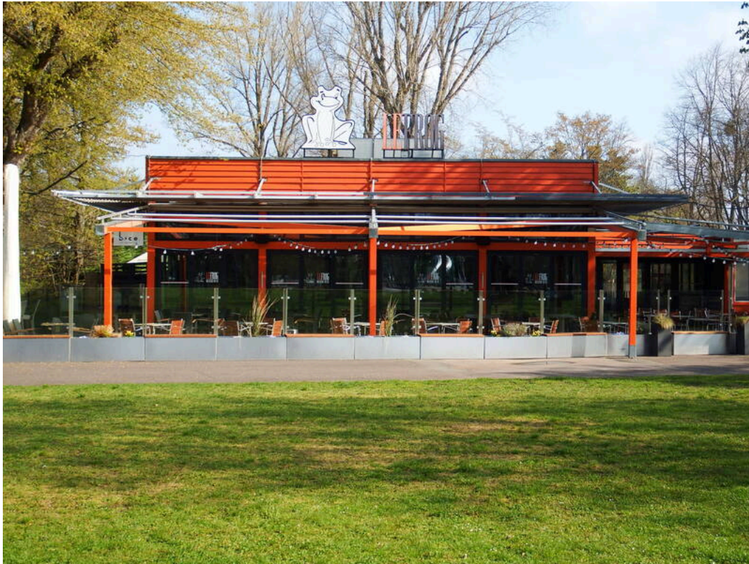
Le Frog Brasserie am See | DSFT Berlin