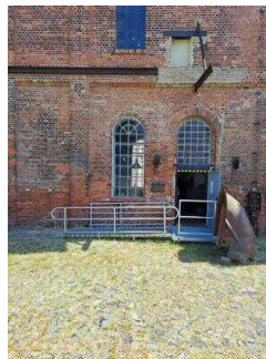
Ausstellungshaus: Historische Schmiede mit Standesamt