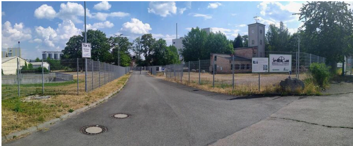
Museum Brikettfabrik "Herrmannschacht" Zeitz