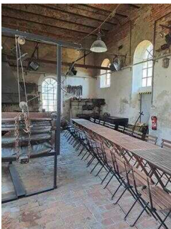
Ausstellungshaus: Historische Schmiede mit Standesamt