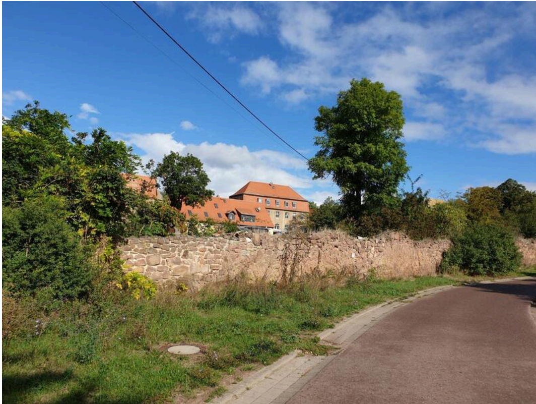
Blick auf Mücheln