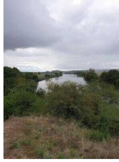
Blick auf die Saale