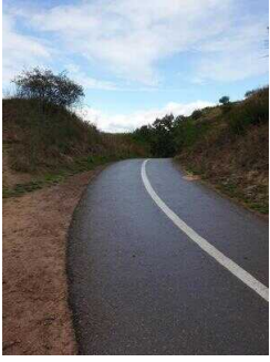
Saaleradweg als Teilabschnitt des Wanderweges