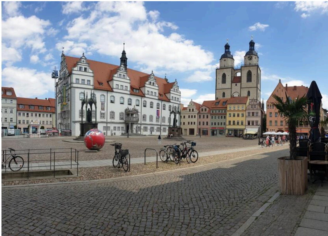
Marktplatz zu Wittenberg