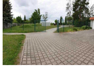
Spielplatz „Magdeburger Tor“ der Stadt Barby (Elbe)