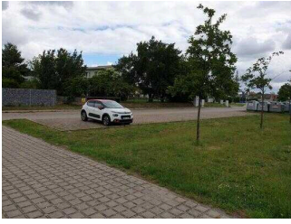
Spielplatz „Magdeburger Tor“ der Stadt Barby (Elbe)