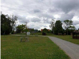
Spielplatz „Magdeburger Tor“ der Stadt Barby (Elbe)