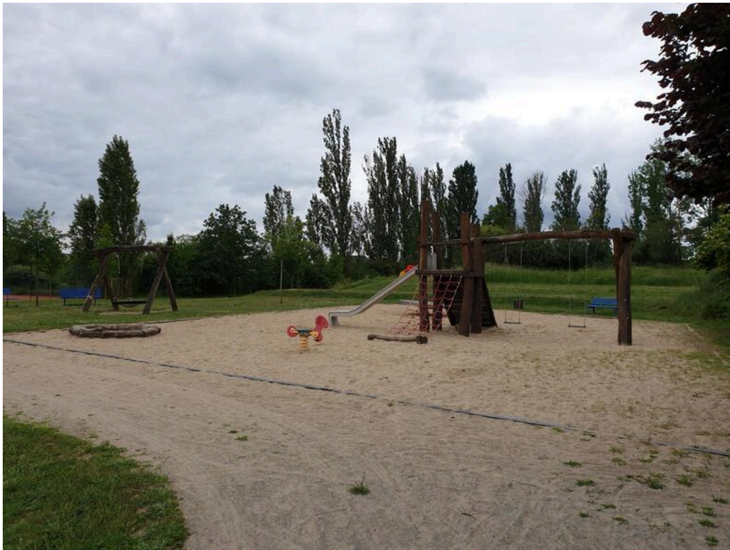
Spielplatz „Magdeburger Tor“ der Stadt Barby (Elbe)