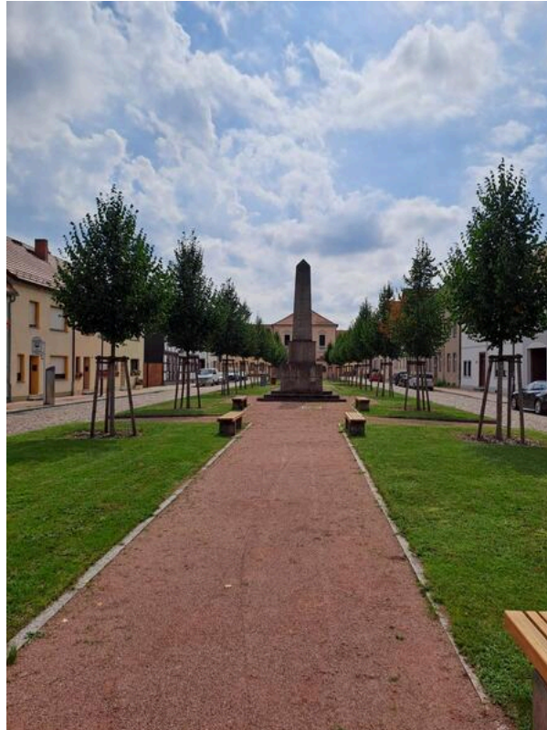
Barrierefrei konzipierter Stadtrundgang durch Wörlitz | ©DSFT Berlin