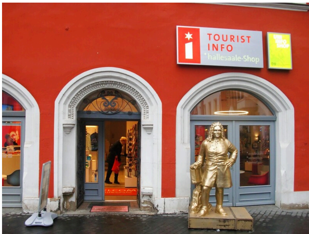
Tourist-Information Halle (Saale)