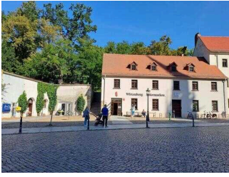
Tourist-Information Lutherstadt Wittenberg