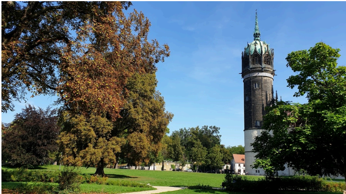
Schlosskirche Lutherstadt Wittenberg