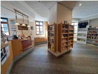
Tourist-Information Lutherstadt Wittenberg