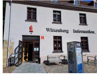
Tourist-Information Lutherstadt Wittenberg