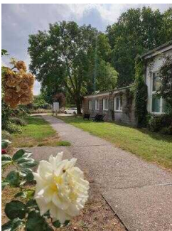
Weg zum Eingang