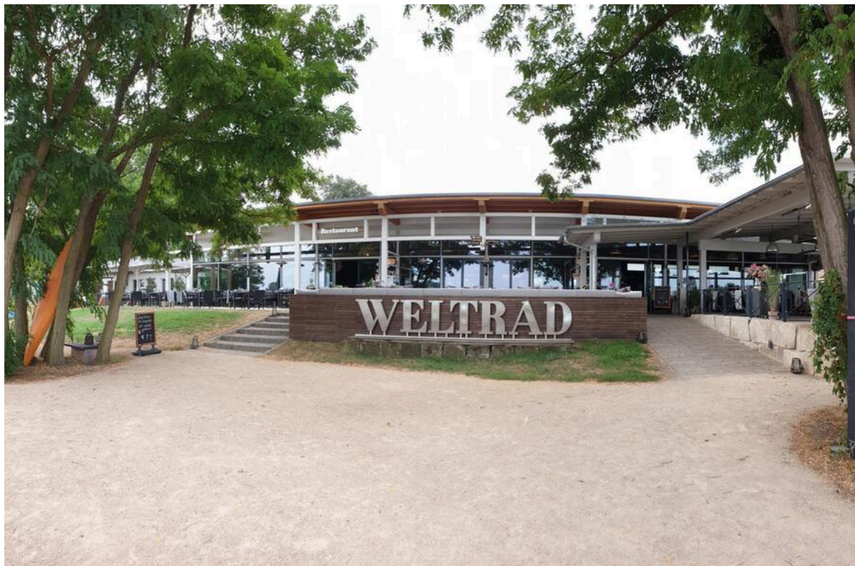
WELTRAD – Quartier und Restaurant | ©Manuela Fischer