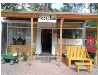
Rezeption mit Shop