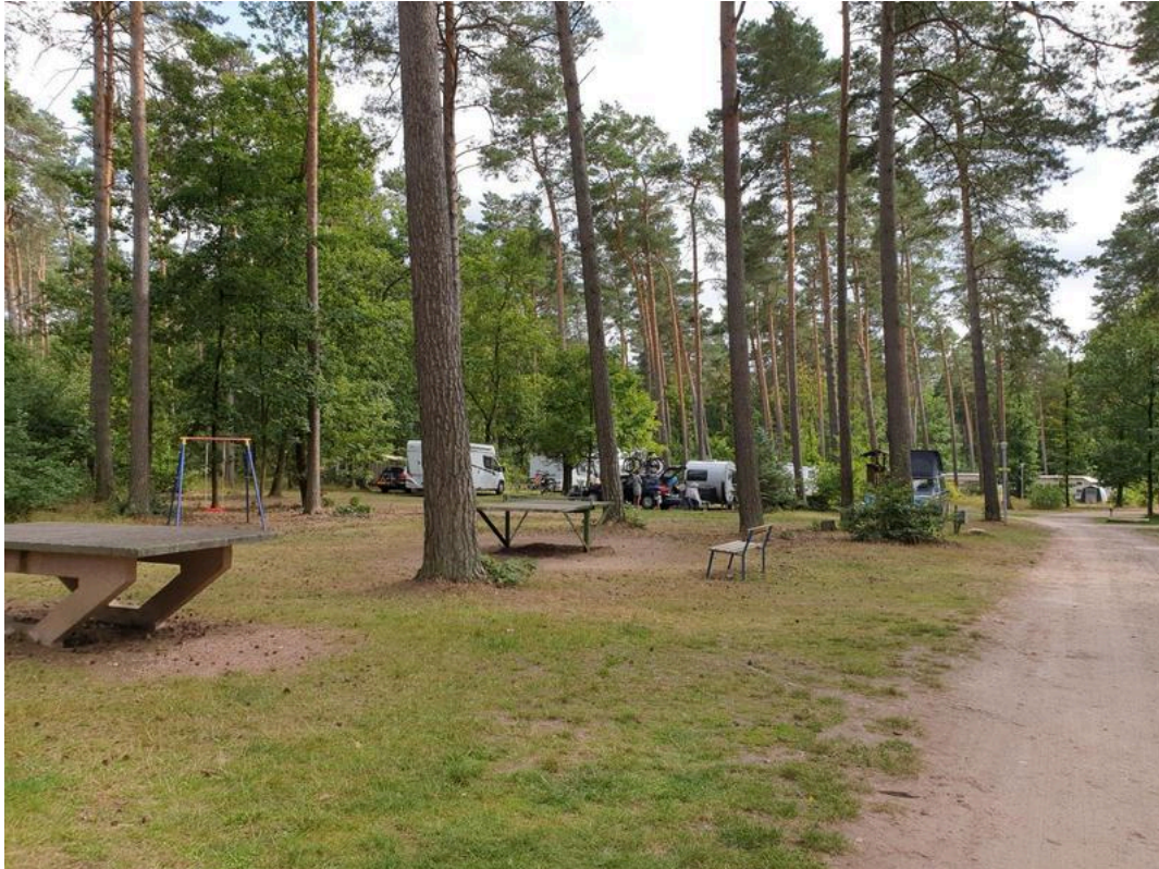
Waldcamping Olympiasee