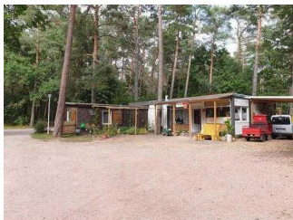
Rezeption mit Shop