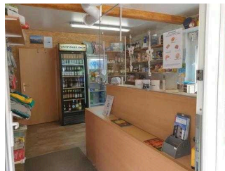
Rezeption mit Shop