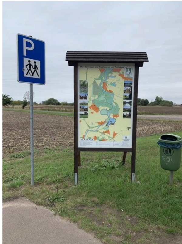
Wanderweg "Plötzkauer Auenwald"