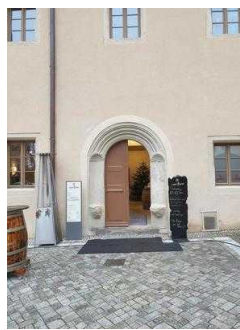
Haupteingang zum Restaurant