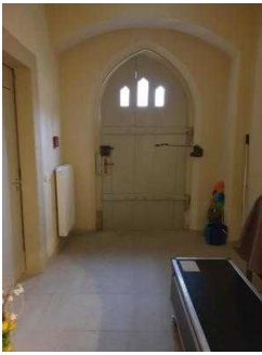
Nebeneingang zum Restaurant