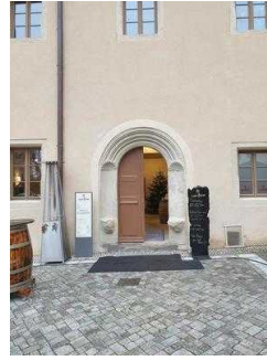
von Bora – Restaurant im Lutherhaus in Wittenberg, Haupteingang