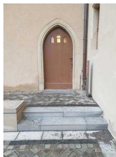
Nebeneingang zum Restaurant