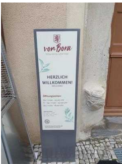
Haupteingang zum Restaurant