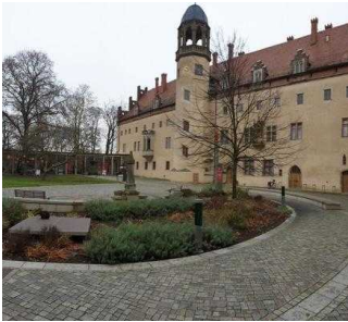
von Bora – Restaurant im Lutherhaus in Wittenberg, Innenhof Lutherhaus