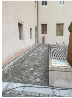
Nebeneingang zum Restaurant