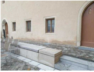
Nebeneingang zum Restaurant