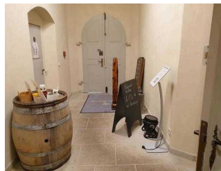
Gastraum "von Bora"