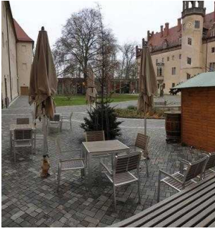
von Bora – Restaurant im Lutherhaus in Wittenberg, Außengastronomie