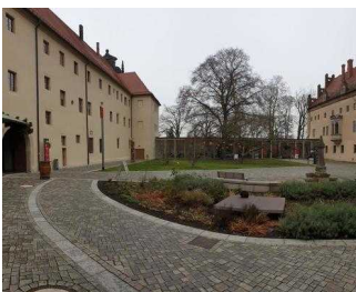
Haupteingang zum Restaurant