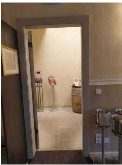
Gastraum "von Bora"