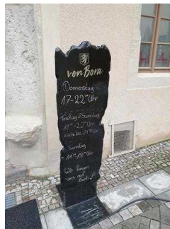
Haupteingang zum Restaurant