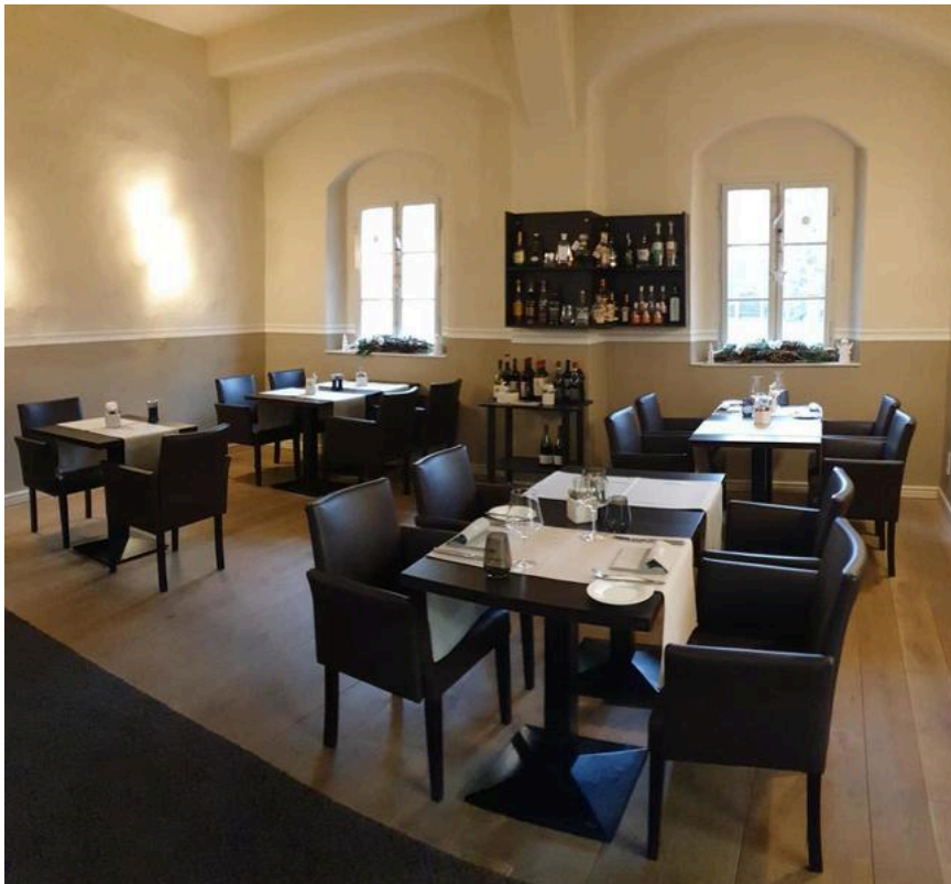
von Bora – Restaurant im Lutherhaus in Wittenberg