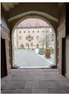
Eingang zum Innenhof