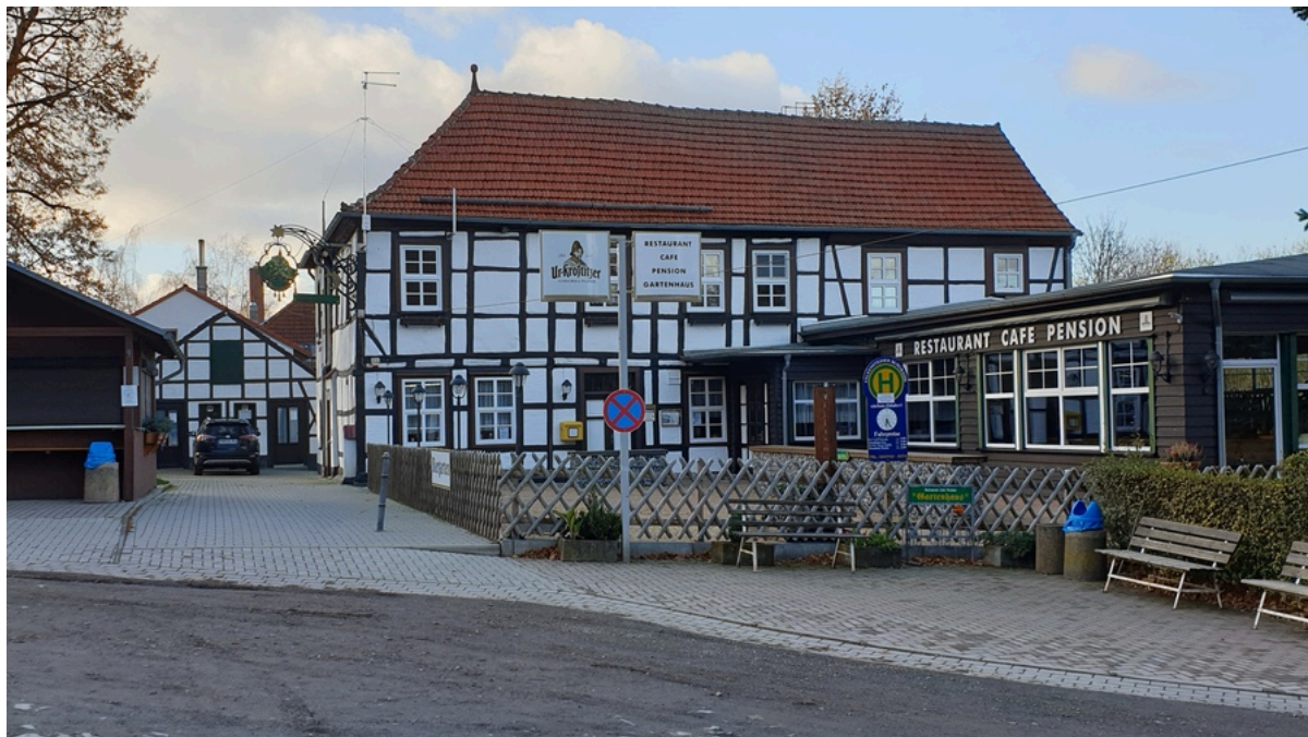
Restaurant-Pension „Gartenhaus“ Pansfelde