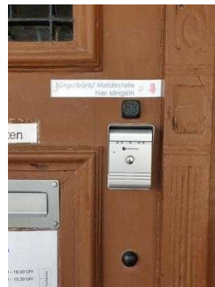
Nebeneingang für Menschen mit Behinderung