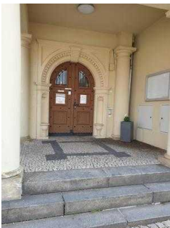
Nebeneingang für Menschen mit Behinderung