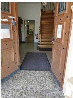
Nebeneingang für Menschen mit Behinderung