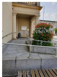
Nebeneingang für Menschen mit Behinderung