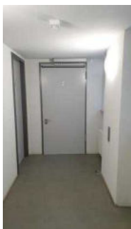
Öffentliches WC für Menschen mit Behinderungen