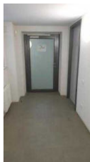
Öffentliches WC für Menschen mit Behinderungen