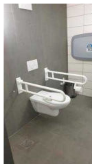
Öffentliches WC für Menschen mit Behinderungen