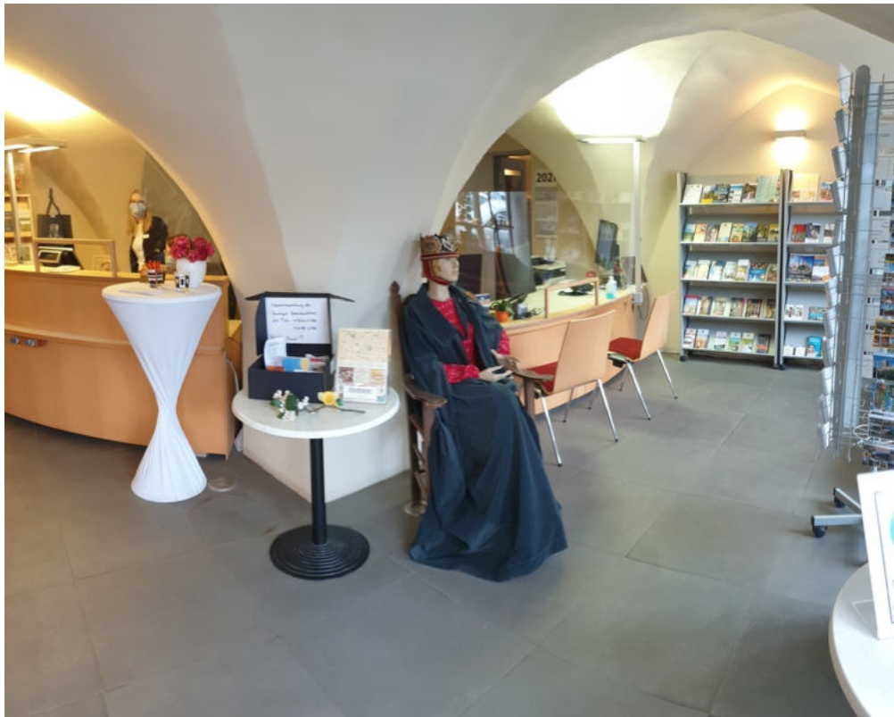
Tourist-Information Naumburg