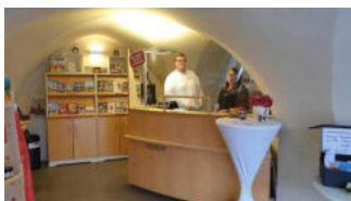
Tourist-Information mit Tresen