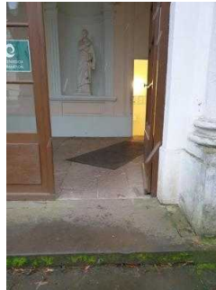
Stufen am Eingang Küchengebäude (Schlossseite)