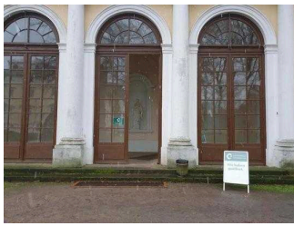
Eingang zur Gartenreich Information (Schlosseite)