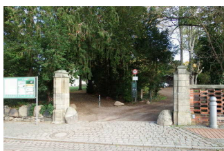
Parkeingang an der Kirchgasse

Der Eingang / Zugang ins Gebäude ist stufenlos möglich.