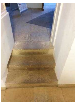
1. Treppe innen zwischen Eingang Schlossseite und Gartenreich Information