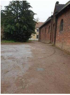
Eingang zur Gartenreich Information (Kirchhofseite)