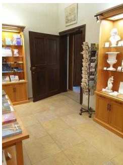
Weg von der Eingangstür zur Kasse