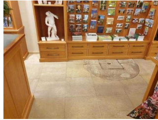
Tresen in der Gartenreich Information