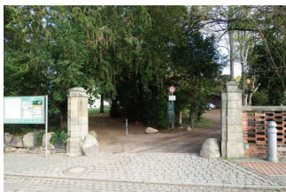
Parkeingang an der Kirchgasse

Der Eingang / Zugang ins Gebäude ist stufenlos möglich.