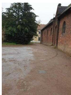
Weg vom Parkeingang zur Gartenreich Information im Küchengebäude (Kirchhofseite)