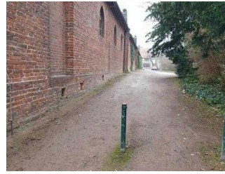
Eingang zur Gartenreich Information (Kirchhofseite)