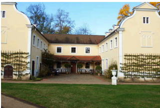
Eingang von der Rückseite des Küchengebäudes