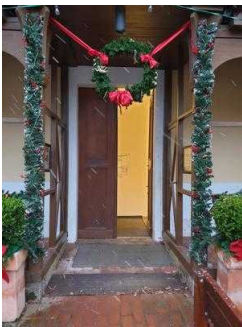
Eingang zur Gartenreich Information (Kirchhofseite)