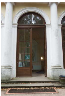
Eingang ins Küchengebäude / Seite zum Schloss