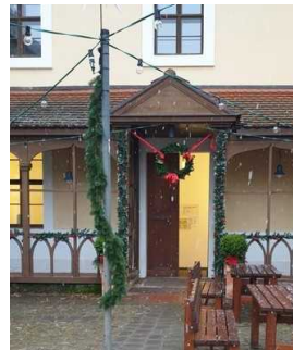
Eingang ins Küchengebäude zur Gartenreich Information (Kirchhofseite)