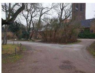
Weg vom Parkeingang zur Gartenreich Information im Küchengebäude (Kirchhofseite)