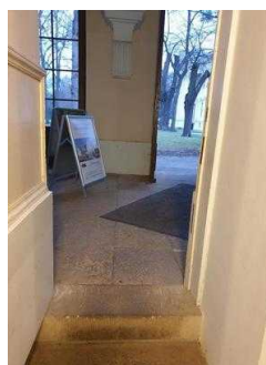
1. Treppe innen zwischen Eingang Schlossseite und Gartenreich Information