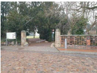
Eingang zur Gartenreich Information (Schlosseite)