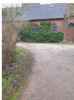
Weg vom Parkeingang zur Gartenreich Information im Küchengebäude (Kirchhofseite)