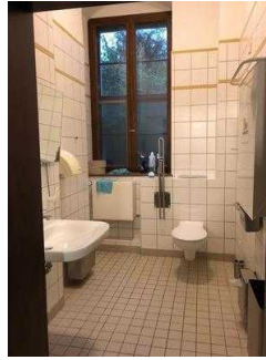
Öffentliches WC für Menschen mit Behinderung