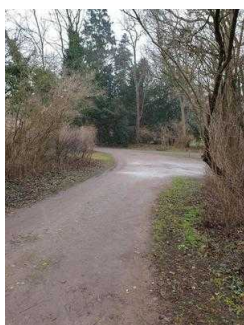
Weg vom Parkeingang zur Gartenreich Information im Küchengebäude (Kirchhofseite)