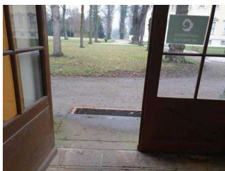
Stufen am Eingang Küchengebäude (Schlossseite)