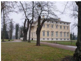
Blick aufs Wörlitzer Schloss