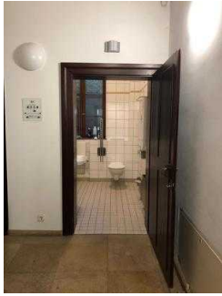
Öffentliches WC für Menschen mit Behinderung