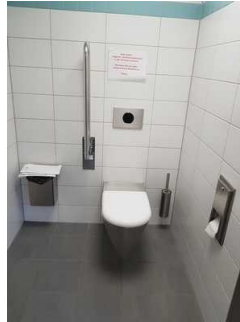
Öffentliches WC im Burggarten