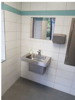
Öffentliches WC im Burggarten