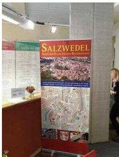
Tourist-Information Hansestadt Salzwedel