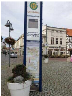
Haltestelle für Rufbus