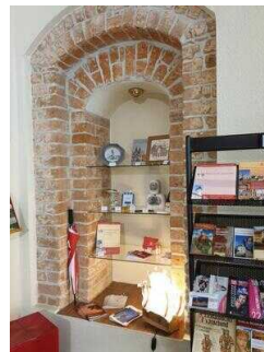
Tourist-Information Hansestadt Salzwedel