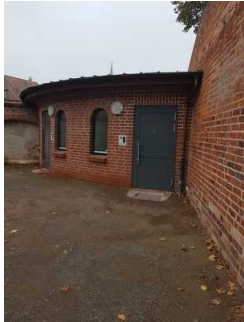
Öffentliches WC im Burggarten