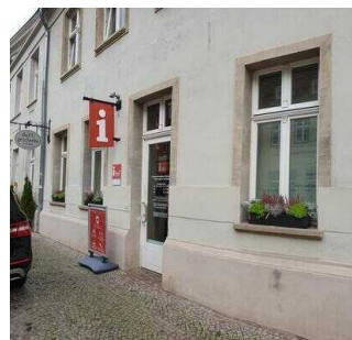
Tourist-Information Hansestadt Salzwedel