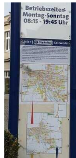
Haltestelle für Rufbus