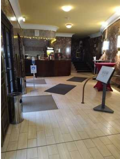
Weg Foyer zu Saal