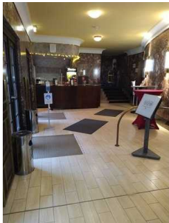
Weg Foyer zu Saal