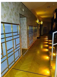
Weg Saal zu WC