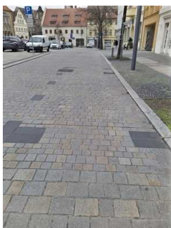
Stellplatz für Menschen mit Behinderung