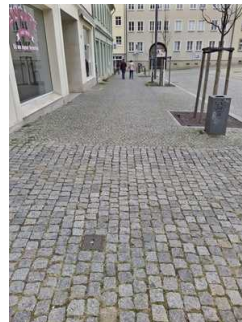
Weg von Parkplatz zu Eingang Capitol