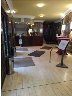
Weg Foyer zu Saal