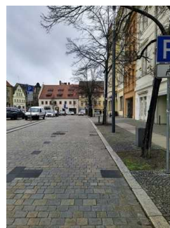
Stellplatz für Menschen mit Behinderung