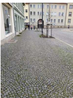
Weg von Parkplatz zu Eingang Capitol