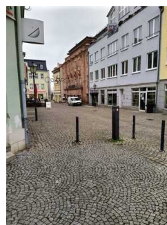
Weg von Parkplatz zu Eingang Capitol (Poller)