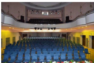
Saal (Blick von Bühne in den Saal)