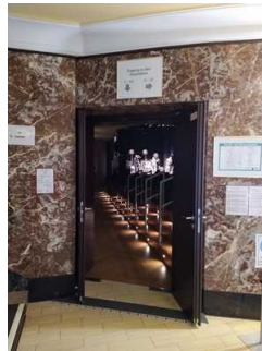
Weg Foyer zu Saal