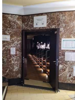
Weg Foyer zu Saal