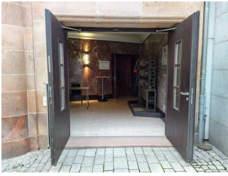
Eingangsbereich Theater Zeit im Capitol (behindertengerechter Zugang)