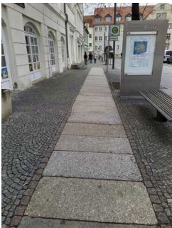
Weg von Parkplatz zu Eingang Capitol