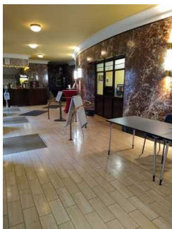
Weg Foyer zu Saal