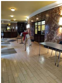
Weg Foyer zu Saal