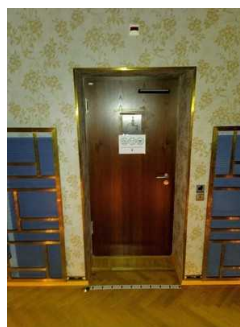
Weg Saal zu WC