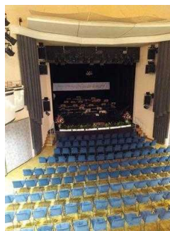
Saal (Blick von Balkon aus)