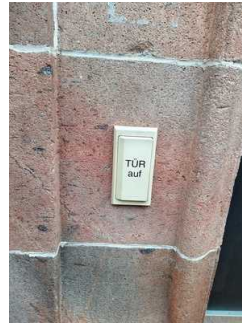
Eingangsbereich Theater Zeit im Capitol (Türöffner)