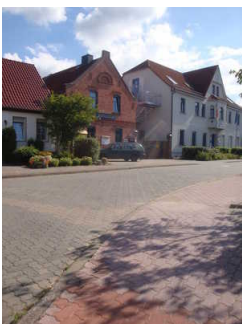
Weg von Bushaltestelle zum Europa Jugendbauernhof (Wegabschnitt 3)