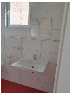
Haus 2: WC für Menschen mit Behinderung