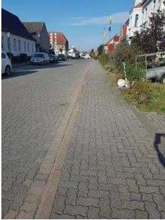
Außenweg vom Hoftor zu Haus 2