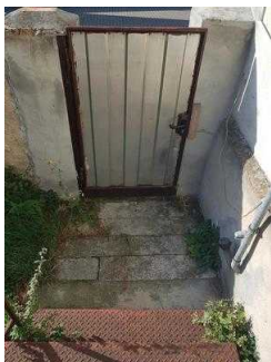
Eingang Haus 2