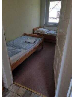
Haus 2: Zimmer 4