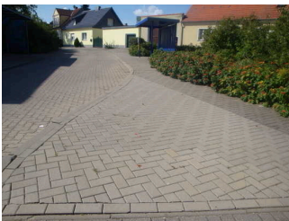
Weg von Bushaltestelle zum Europa Jugendbauernhof (Wegabschnitt 1)