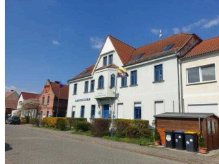
Außenweg vom Hoftor zu Haus 2