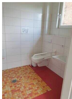
Haus 2: WC für Menschen mit Behinderung