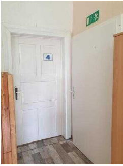
Haus 2: Zimmer 4