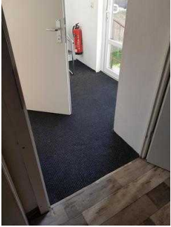
Haus 2: Tür zwischen Vorraum WC/Dusche und Zimmer 4