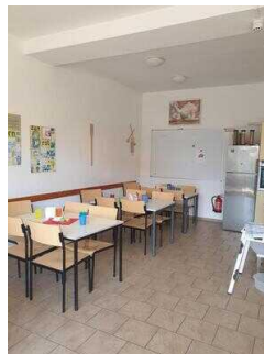
Rezeption – zugleich Seminarraum mit Küche