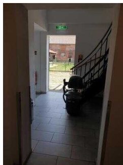
Flur im Seminargebäude zum öffentlichen WC