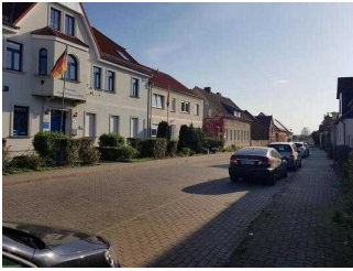
Parkbuchten gegenüber dem Hof