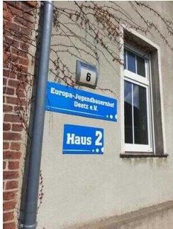
Eingang Haus 2