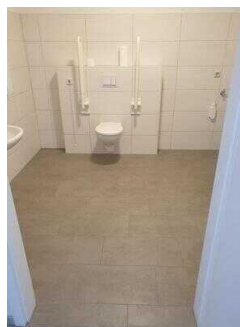
Seminargebäude, EG: Öffentliches WC für Menschen mit Behinderung