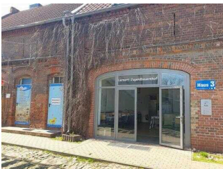
Rezeption – zugleich Seminarraum mit Küche