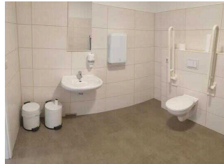
Seminargebäude, EG: Öffentliches WC für Menschen mit Behinderung