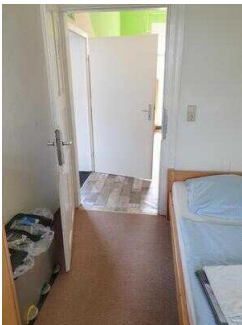
Haus 2: Zimmer 4