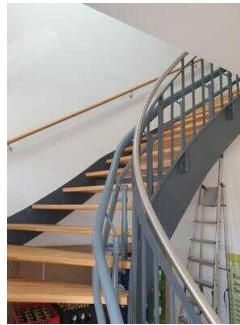
Treppe zu den oberen Seminarräumen