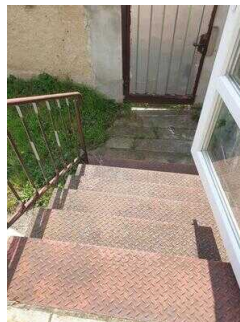
Haus 2: Außentreppe zu Zimmer 4 und Dusche/WC für Menschen mit Behinderung