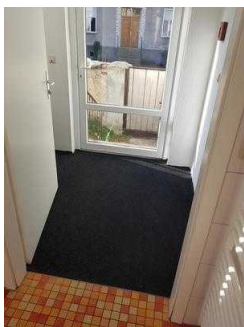
Haus 2: WC für Menschen mit Behinderung