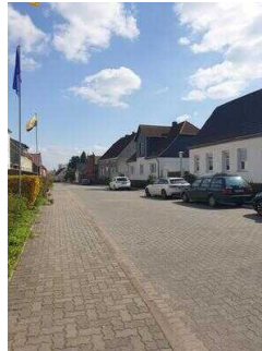
Parken auf der Strasse