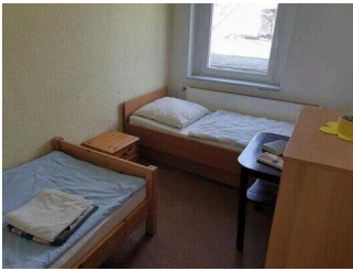
Haus 2: Zimmer 4