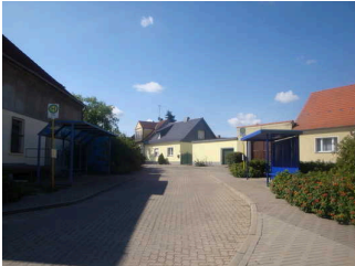
Bus-Haltestelle "Zerbster Straße"