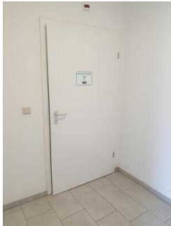
Seminargebäude, EG: Öffentliches WC für Menschen mit Behinderung