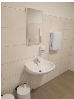
Seminargebäude, EG: Öffentliches WC für Menschen mit Behinderung