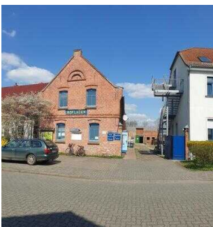
Weg vom Parkplatz zum Eingang