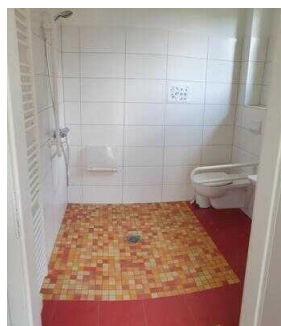
Haus 2: WC für Menschen mit Behinderung