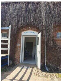
Eingang Seminargebäude / öffentliches WC