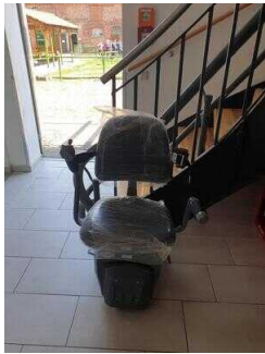
Treppensitzlift zu den oberen Seminarräumen