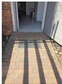
Eingang Seminargebäude / öffentliches WC