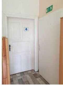
Haus 2: Tür zwischen Vorraum WC/Dusche und Zimmer 4 (rechts im Bild)