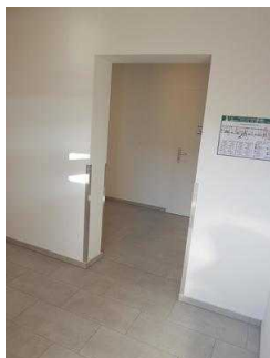
Flur im Seminargebäude zum öffentlichen WC