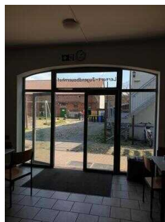
Rezeption – zugleich Seminarraum mit Küche