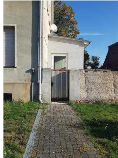
Eingang Haus 2