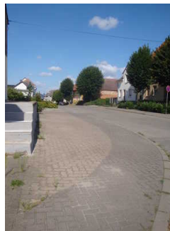
Weg von Bushaltestelle zum Europa Jugendbauernhof (Wegabschnitt 2)