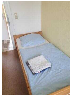
Haus 2: Zimmer 4