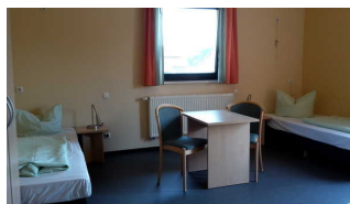
Haupthaus 1. OG: Zimmer 36