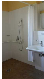
Haupthaus 1. OG: Bad im Zimmer 36