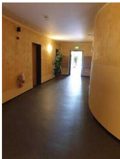
Haupthaus 1. OG: Flur vom Aufzug/Treppe zu den Zimmern