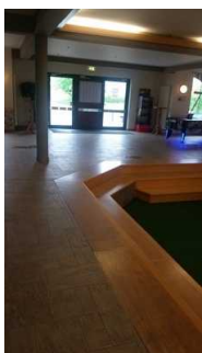
Flur vom Eingang zum Aufzug/Treppe/ Speisesaal