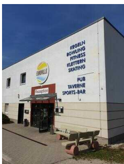
Eingang zur Rezeption / Restaurant