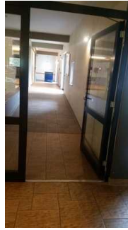
Rampe zum Speisesaal