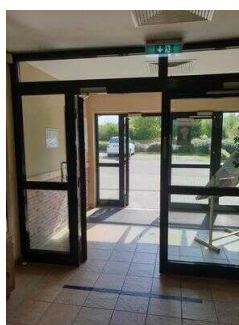
Eingang zur Rezeption