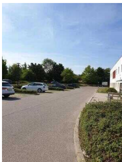
Weg vom Parkplatz zum Eingang Rezeption / Restaurant