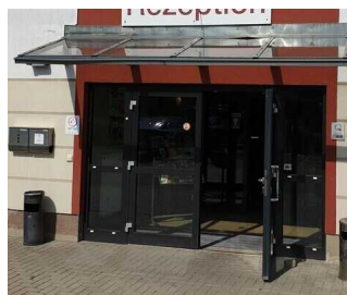
Eingang zur Rezeption / Restaurant