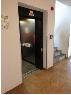
Haupthaus: Aufzug EG – OG