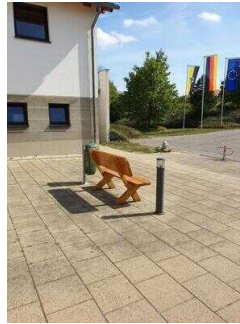
Weg vom Behindertenparkplatz zum Haupthaus