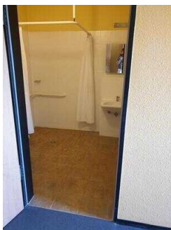
Haupthaus 1. OG: Bad im Zimmer 26