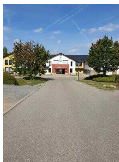
Weg zum Haupthaus