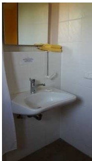
Haupthaus 1. OG: Bad im Zimmer 36