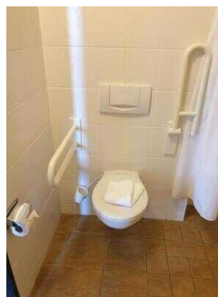
Haupthaus 1. OG: Bad im Zimmer 26