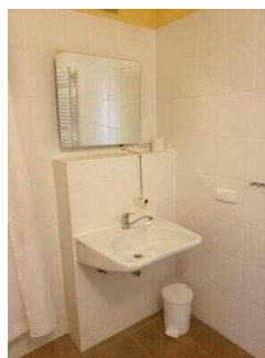
Haupthaus 1. OG: Bad im Zimmer 26