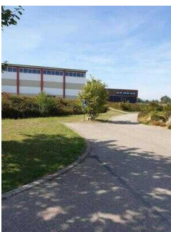
Behindertenparkplatz am Haupthaus