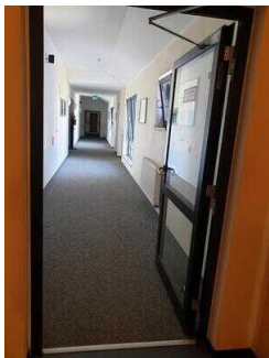
Haupthaus 1. OG: Flur vom Aufzug/Treppe zu den Zimmern