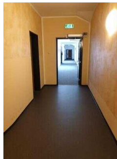
Haupthaus 1. OG: Flur vom Aufzug/Treppe zu den Zimmern