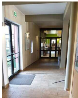
Weg von Treppe/ Aufzug zum Speisesaal