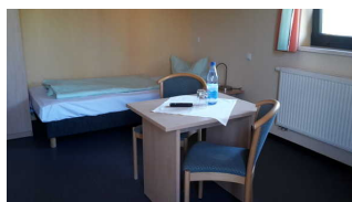
Haupthaus 1. OG: Zimmer 36