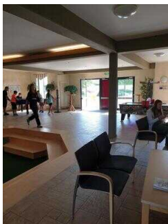
Haupthaus EG: Weg vom Eingang zum WC für Menschen mit Behinderung