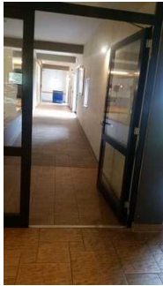
Haupthaus: Speisesaal Eingang