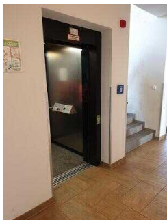
Haupthaus: Aufzug EG – OG