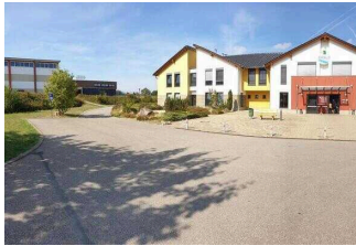
Weg vom Behindertenparkplatz zum Haupthaus