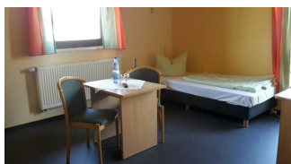
Haupthaus 1. OG: Zimmer 36