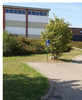
Behindertenparkplatz am Haupthaus