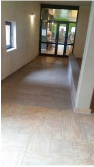
Rampe zum Speisesaal