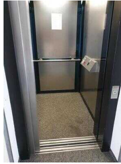
Haupthaus: Aufzug EG – OG