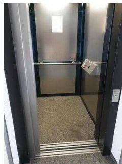
Haupthaus: Aufzug EG – OG