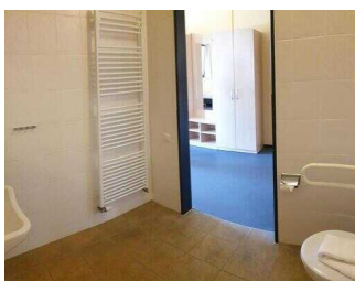
Haupthaus 1. OG: Bad im Zimmer 26