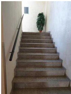
Treppe von EG – OG