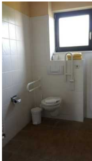
Haupthaus 1. OG: Bad im Zimmer 36