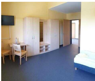
Haupthaus 1. OG: Zimmer 26