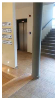
Flur vom Eingang zum Aufzug/Treppe