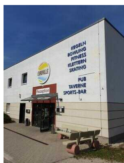
Eingang zur Rezeption