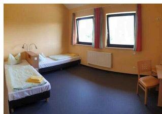
Haupthaus 1. OG: Zimmer 26