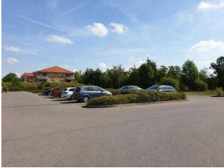
Parkplatz an der Rezeption / Restaurant