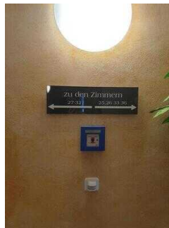
Haupthaus 1. OG: Flur vom Aufzug/Treppe zu den Zimmern