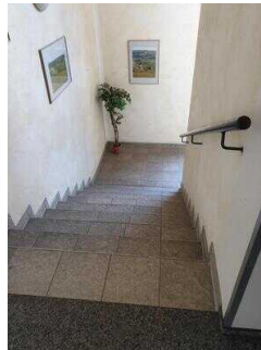
Treppe von EG – OG