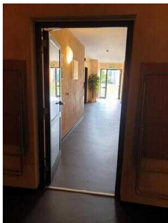
Haupthaus 1. OG: Flur vom Aufzug/Treppe zu den Zimmern