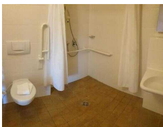
Haupthaus 1. OG: Bad im Zimmer 26