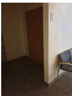
Haupthaus EG: Weg vom Eingang zum WC für Menschen mit Behinderung