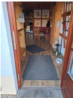
Eingang zum Restaurant "Zur Klippe"