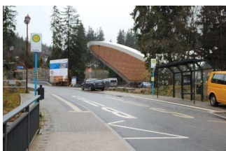
Blick auf die ÖPNV Haltestelle –sichtbare Bodenindikatoren