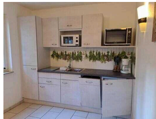
Fewo 52: Küche