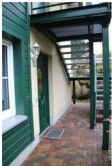
Eingang zur Ferienwohnung 52