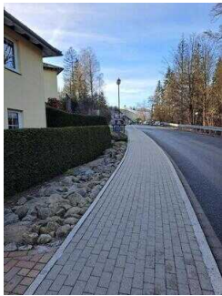
Weg von der Fewo 52 zum Restaurant "Zur Klippe"