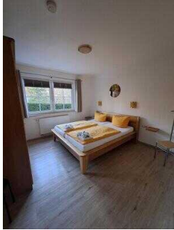
Fewo 52: Schlafräum