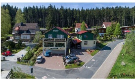
Ferienanlage "Zum Wildbach" Schierke