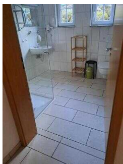
Fewo 52: Bad mit WC und Dusche