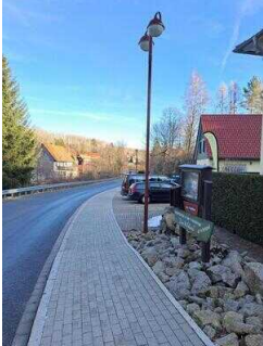
Blick vom Zugang Fewo 52 zum Parkplatz