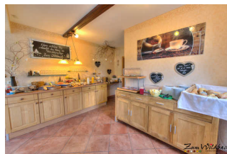
Frühstücksbuffet im Restaurant (nur über Treppen erreichbar)