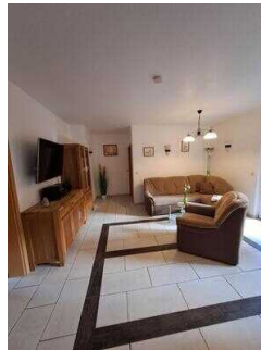
Fewo 52: Wohnraum