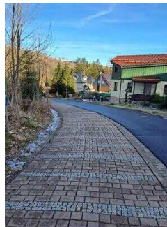
Weg von der Fewo 52 zum Restaurant "Zur Klippe"