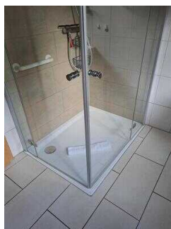
Fewo 52: Bad mit WC und Dusche