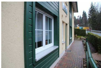
Fortführung des Weges zur Ferienwohnung 52 nach hinten links