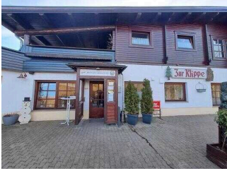
Eingang zum Restaurant "Zur Klippe"