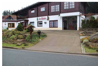
Zufahrt und Zugang Restaurant