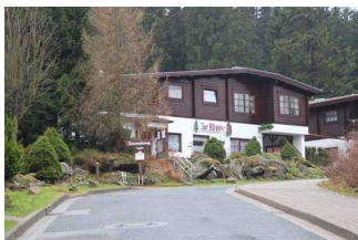
Blick auf das Restaurant