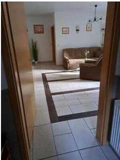
Fewo 52: Wohnraum