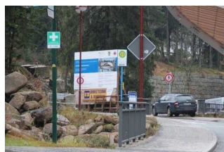
Bushaltestelle "Arena", Buslinie 264