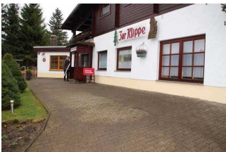
Parkmöglichkeit vor Restaurant "Zur Klippe"