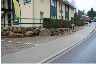
Weg vom Parkplatz zur Ferienwohnung 52