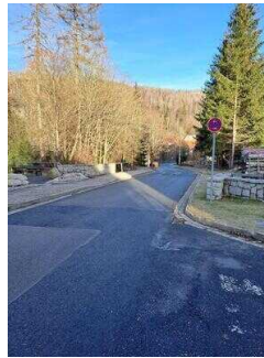
Weg von der Fewo 52 zum Restaurant "Zur Klippe"