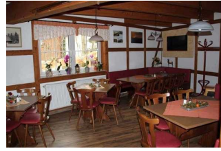
Restaurant "Zur Klippe"