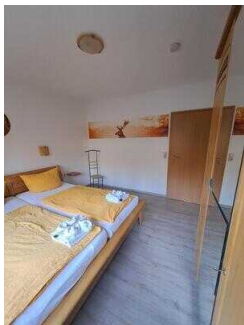
Fewo 52: Schlafräum