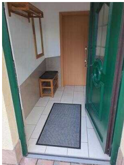
Eingang zur Ferienwohnung 52