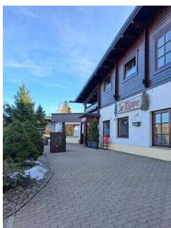
Weg vom Parkplatz am Restaurant "Zur Klippe" zum Eingang