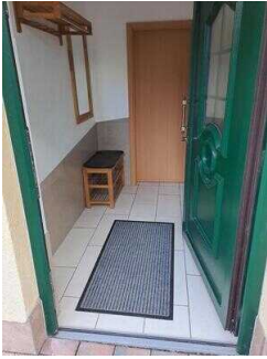
Fewo 52: Flur