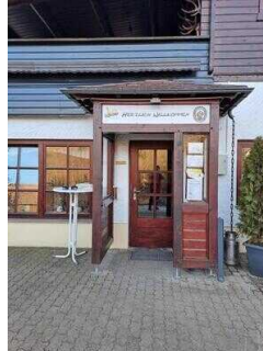
Eingang zum Restaurant "Zur Klippe"