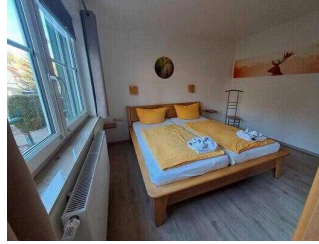
Fewo 52: Schlafräum