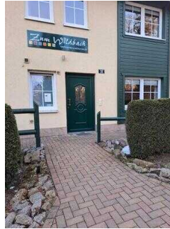
Weg vom Parkplatz zur Ferienwohnung 52