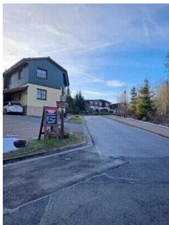
Weg von der Fewo 52 zum Restaurant "Zur Klippe"