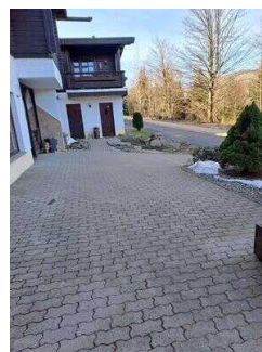
Weg vom Parkplatz am Restaurant "Zur Klippe" zum Eingang