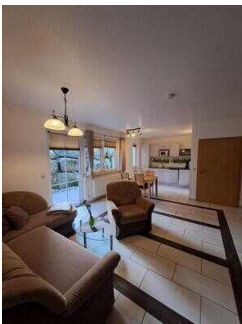
Fewo 52: Wohnraum