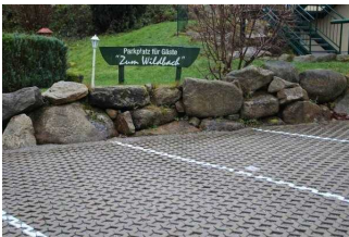
Parkplatz an der Fewo 52