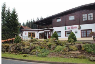
Restaurant "Zur Klippe"