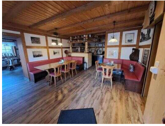
Restaurant "Zur Klippe"