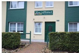
Ferienhaus mit Ferienwohnung 52