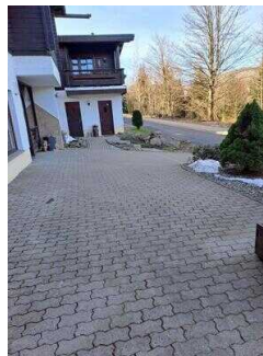
Parkplatz oberhalb der Ferienwohnung am Restaurant "Zur Klippe"