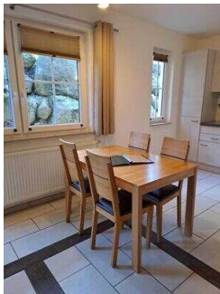
Fewo 52: Küche