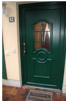
Eingang zur Ferienwohnung 52