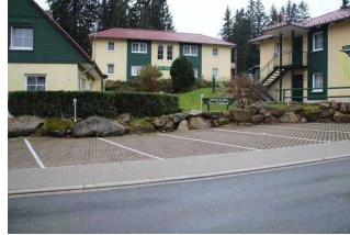
Parkplatz an der Fewo 52