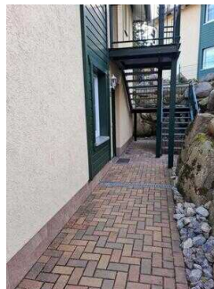
Weg vom Parkplatz zur Ferienwohnung 52