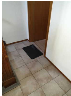
Eingang in die Ferienwohnung Heine