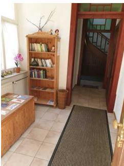
Hausflur zwischen Eingang außen und Eingang Ferienwohnung