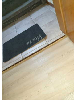
Flur im Eingang der Ferienwohnung