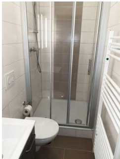
WC und Dusche