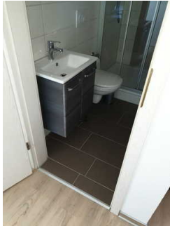
WC und Dusche