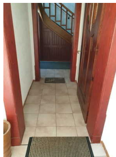
Hausflur zwischen Eingang außen und Eingang Ferienwohnung