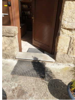
Eingang ins Haus