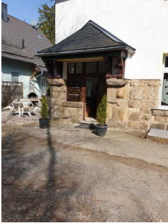
Eingang ins Haus