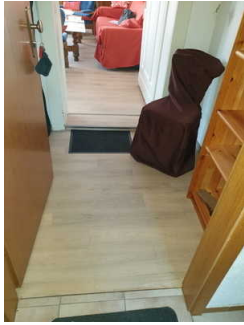
Flur im Eingang der Ferienwohnung