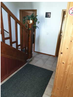
Hausflur zwischen Eingang außen und Eingang Ferienwohnung