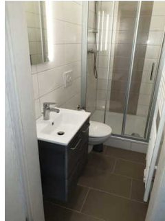
WC und Dusche