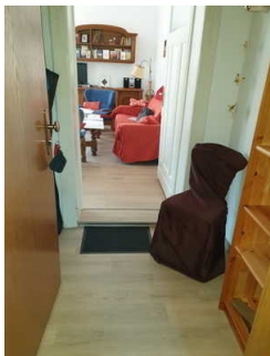
Blick durch den Flur ins Wohnzimmer