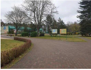
Weg von der Rezeption zu Bungalow 16 und 17