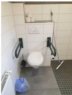
Bungalows 16 und 17 (baugleich): Badezimmer