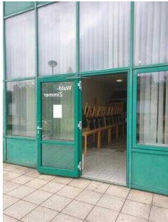
Seminarraum Waldzimmer: Eingangsbereich