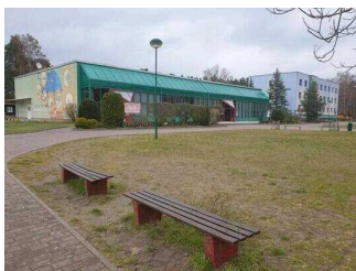
Blick auf Speisesaal/ Seminarraum Waldzimmer