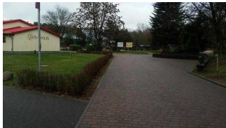
Weg von der Rezeption zum Turmhaus