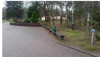
Weg von Rezeption zum Turmhaus