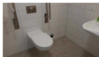
Turmhaus : Öffentliches WC für Menschen mit Behinderung