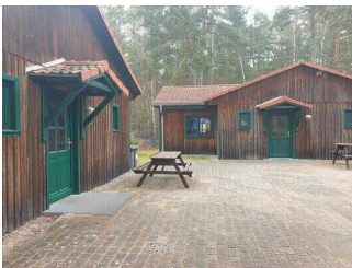
Bungalow 16 und 17 (baugleich): Eingangsbereich