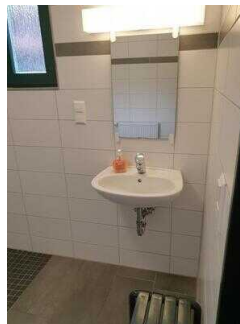
Bungalows 16 und 17 (baugleich): Badezimmer