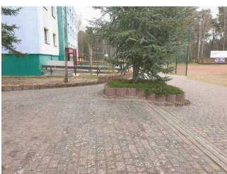
Weg von Rezeption zum Speisesaal/ Seminarraum Waldzimmer