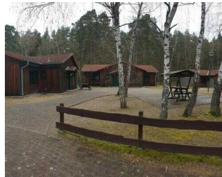
Weg von der Rezeption zu Bungalow 16 und 17