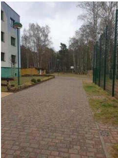
Weg von der Rezeption zu Bungalow 16 und 17