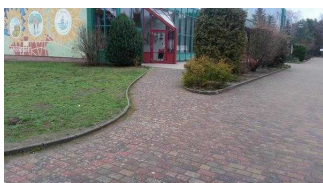
Weg zwischen Rezeption und Speisesaal / Seminarraum Waldzimmer