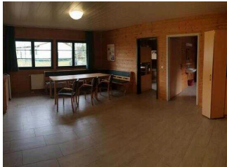
Bungalows 16 und 17 (baugleich): Aufenthaltsraum