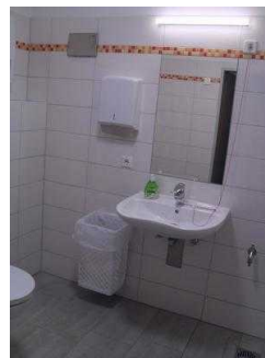
Turmhaus : Öffentliches WC für Menschen mit Behinderung