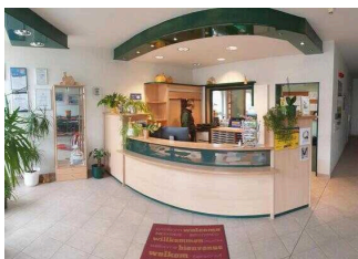
Lobby im Eingangsbereich