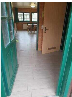
Bungalow 16 und 17 (baugleich): Eingangsbereich