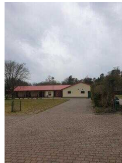
Blick Richtung Rezeption