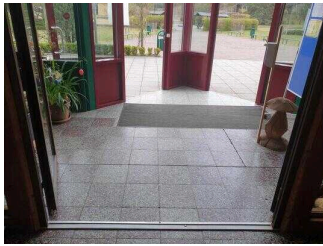
Speisesaal: 2. Tür am Eingang