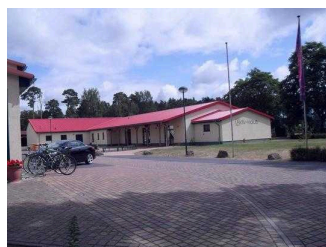
Kinder- und Jugenderholungszentrum (KiEZ) Arendsee/ Altmark