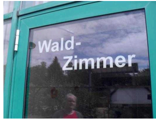
Seminarraum Waldzimmer: Eingangsbereich