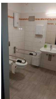
Turmhaus : Öffentliches WC für Menschen mit Behinderung