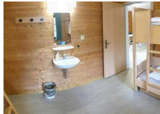
Waschbecken im Schlafraum