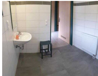
Bungalows 16 und 17 (baugleich): Badezimmer