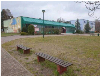
Blick auf Speisesaal/ Seminarraum Waldzimmer