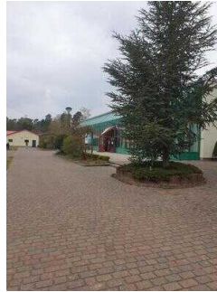
Weg von der Rezeption zu Bungalow 16 und 17