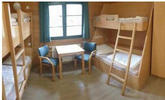
Bungalow 16 und 17 (baugleich): Schlafraum