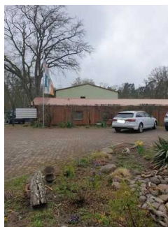
Parkplatz an der Rezeption