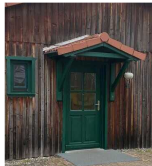
Bungalow 16 und 17 (baugleich): Eingangsbereich