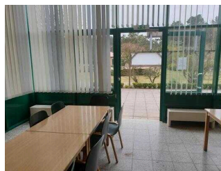
Seminarraum Waldzimmer: Eingangsbereich