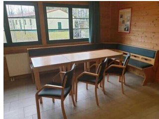
Bungalows 16 und 17 (baugleich): Aufenthaltsraum