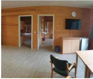
Eingang in die Schlafräume