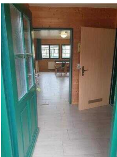
Bungalows 17 und 18 (baugleich): Flur im Eingangsbereich