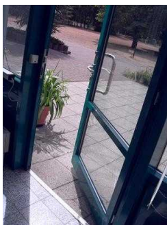
Seminarraum Waldzimmer: Eingangsbereich Tür