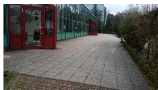
Weg zwischen Rezeption und Speisesaal / Seminarraum Waldzimmer