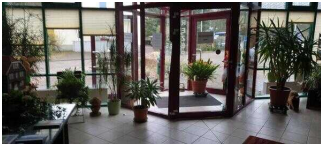
Lobby im Eingangsbereich