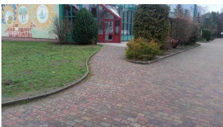
Weg zwischen Rezeption und Speisesaal / Seminarraum Waldzimmer