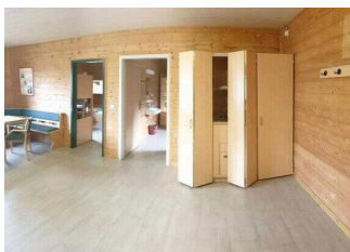
Bungalows 16 und 17 (baugleich): Aufenthaltsraum