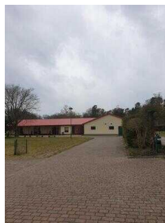
Blick Richtung Rezeption