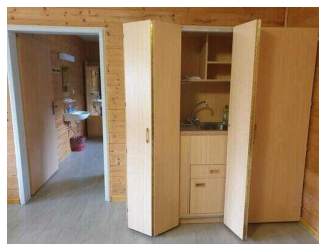
Bungalows 16 und 17 (baugleich): Kochnische im Aufenthaltsraum