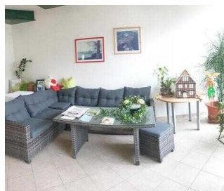
Lobby im Eingangsbereich