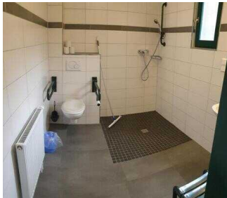
Bungalows 16 und 17 (baugleich): Badezimmer