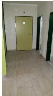
Turmhaus: Weg vom Eingang zum öffentlichen WC