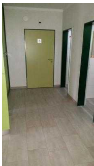
Tür zum WC