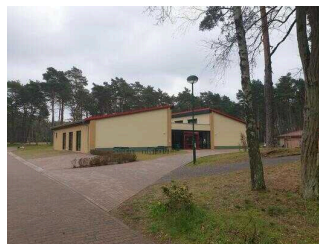
Weg von Rezeption zum Turmhaus