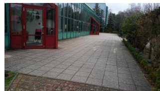
Weg zwischen Rezeption und Speisesaal / Seminarraum Waldzimmer