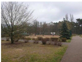
Weg von Rezeption zum Turmhaus