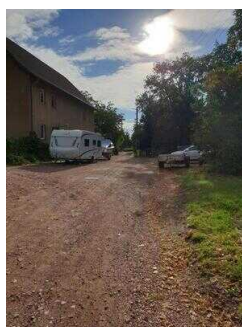
Weg vom Parkplatz Gimritzer Weg zum Einstiegspunkt Naturlehrpfad