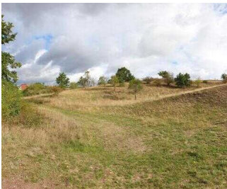
Blick in die Landschaft