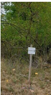
1. Abschnitt ab Einstieg Wanderweg bis Scharngrund