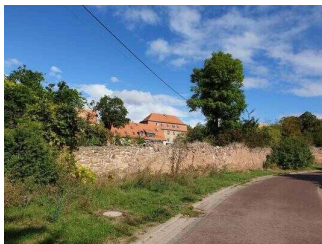
Blick auf Mücheln