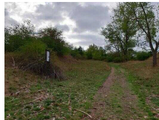
1. Abschnitt ab Einstieg Wanderweg bis Scharngrund