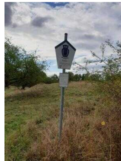
1. Abschnitt ab Einstieg Wanderweg bis Scharngrund