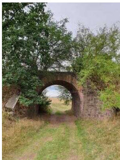
2. Abschnitt ab Scharngrund bis Saaleradwanderweg