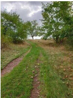
1. Abschnitt ab Einstieg Wanderweg bis Scharngrund