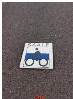
Logo auf dem Saaleradwanderweg