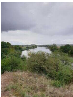
Blick auf die Saale