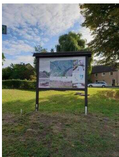
Naturpark Unteres Saaletal – Naturlehrpfad "Porphyrlandschaft Wettin/Gimritz" – 2.5 km