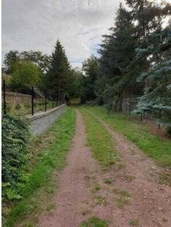
1. Abschnitt ab Einstieg Wanderweg bis Scharngrund