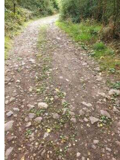
1. Abschnitt ab Einstieg Wanderweg bis Scharngrund