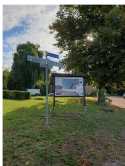
Weg vom Parkplatz Gimritzer Weg zum Einstiegspunkt Naturlehrpfad