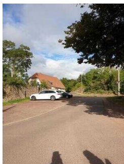
Parkplatz in Mücheln, Gimritzer Weg