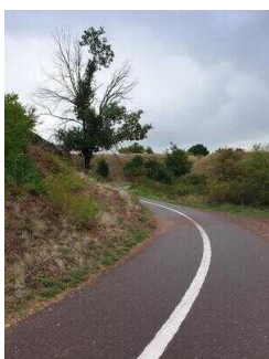
Rückweg auf dem Saaleradwanderweg