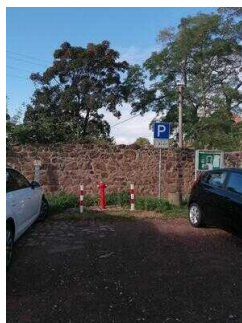
Parkplatz in Mücheln, Gimritzer Weg