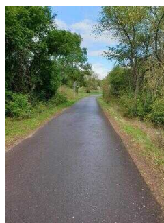
Rückweg auf dem Saaleradwanderweg