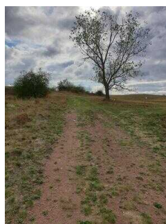
2. Abschnitt ab Scharngrund bis Saaleradwanderweg