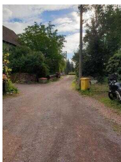
Weg vom Parkplatz Gimritzer Weg zum Einstiegspunkt Naturlehrpfad