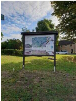
Übersichtstafel am Parkplatz