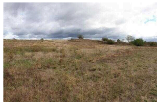
2. Abschnitt ab Scharngrund bis Saaleradwanderweg