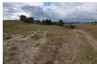
Naturpark Unteres Saaletal – Naturlehrpfad "Porphyrlandschaft Wettin/Gimritz" – 2.5 km