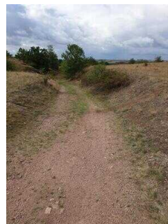
1. Abschnitt ab Einstieg Wanderweg bis Scharngrund