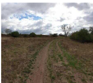
2. Abschnitt ab Scharngrund bis Saaleradwanderweg