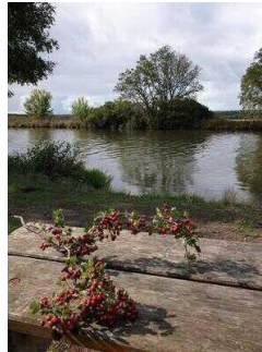
Rastplatz an der Saale