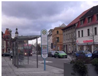
Bushaltestelle am Markt