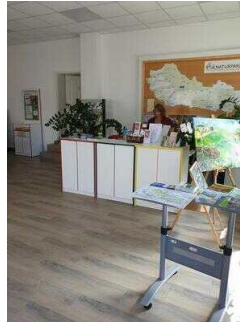
Weg durch den Raum