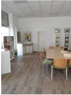
Weg durch den Raum