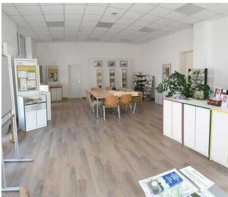
Kundenraum mit Infotresen