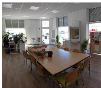
Naturpark Fläming Sachsen-Anhalt – Infozentrum in Coswig/Anhalt