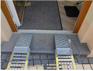
Stufe am Eingang