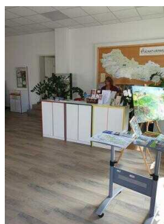
Weg durch den Raum