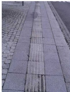
Bushaltestelle am Markt