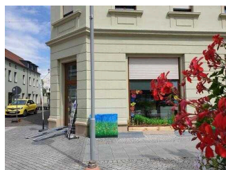
Naturpark Fläming Sachsen-Anhalt – Infozentrum in Coswig/Anhalt