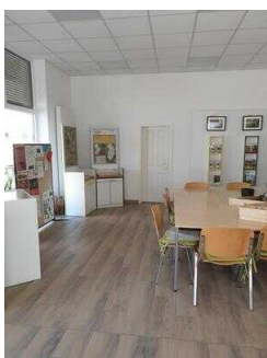
Weg durch den Raum