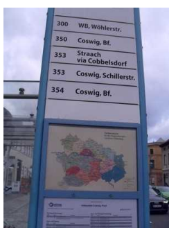
Bushaltestelle am Markt