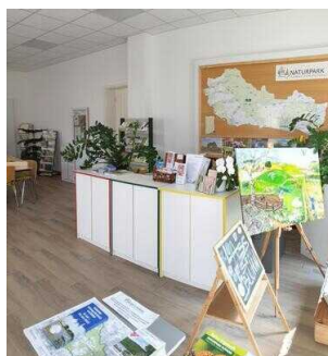
Naturpark Fläming Sachsen-Anhalt – Infozentrum in Coswig/Anhalt