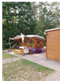
Weg von der Schranke zum WC-Gebäude am Wohnmobilstellplatz