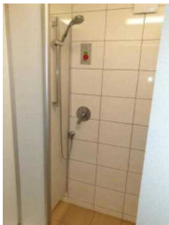
Duschkabinen im Duschgebäude