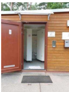
WC-Kabinen Damen im WC-Gebäude