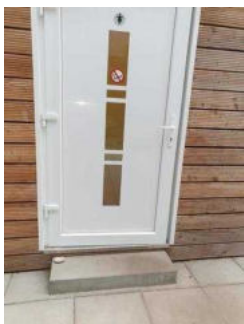
Eingangsbereich Duschgebäude Damen und Herren