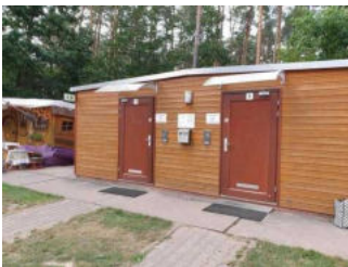
Weg von der Schranke zum WC-Gebäude am Wohnmobilstellplatz