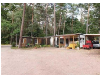
Rezeption mit Shop