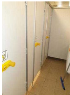
Duschkabinen im Duschgebäude