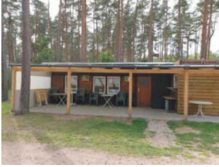
Biergarten / Terrasse