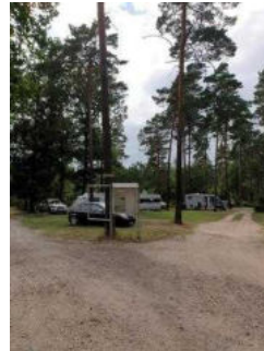
Weg von der Schranke zum WC-Gebäude am Wohnmobilstellplatz