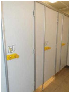
Duschkabinen im Duschgebäude