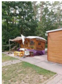
Weg von der Schranke zum WC-Gebäude am Wohnmobilstellplatz