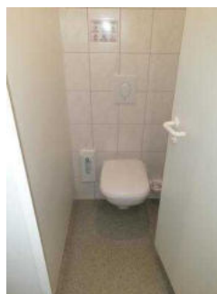
WC-Kabinen Damen im WC-Gebäude