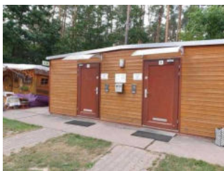
Weg von der Schranke zum WC-Gebäude am Wohnmobilstellplatz