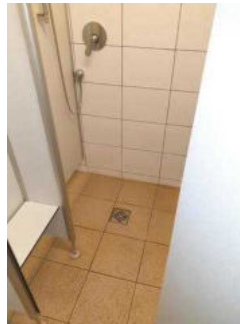
Duschkabinen im Duschgebäude