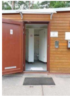
Eingangsbereich WC-Gebäude Damen und Herren