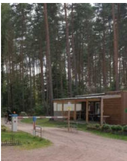
Weg von der Schranke zum Bistro