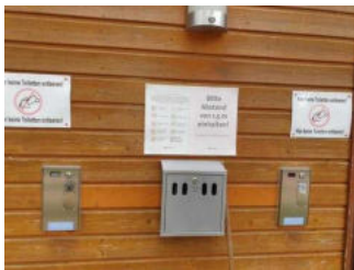
Eingangsbereich WC-Gebäude Damen und Herren