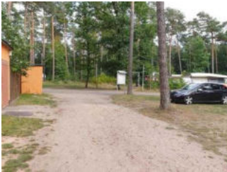
Weg von der Schranke zum WC-Gebäude am Wohnmobilstellplatz