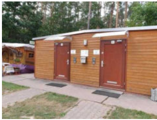
Eingangsbereich WC-Gebäude Damen und Herren