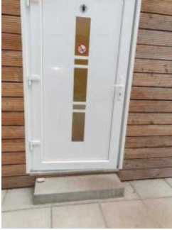
Stufe am Eingang ins Duschgebäude