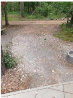
Stufenloser Zugang zum Duschgebäude