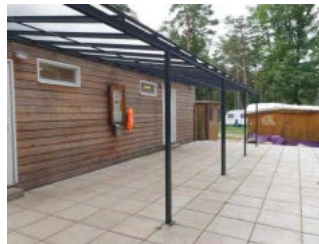
Eingangsbereich Duschgebäude Damen und Herren