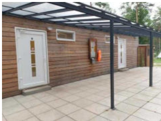
Eingangsbereich Duschgebäude Damen und Herren