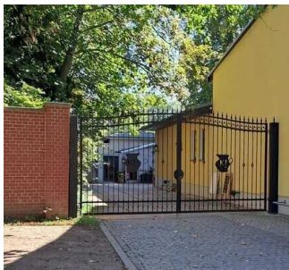
Stufenloser Eingang zum Biergarten