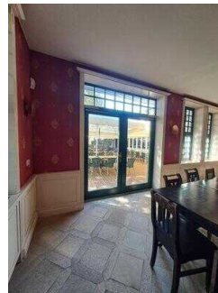
Tür zur Terrasse