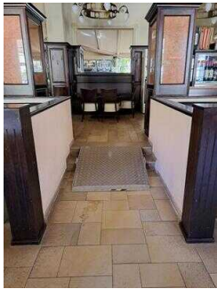
Stufen mit Anlegerampe zwischen Saal und übrigen Gasträumen