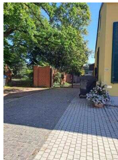
Stufenloser Eingang zum Biergarten