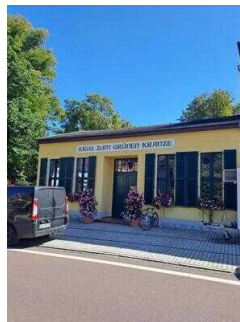
Krug Zum Grünen Kranze