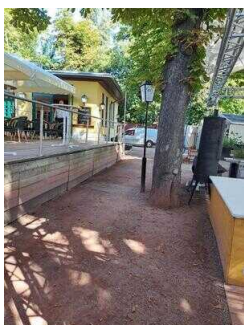
Stufenloser Eingang zum Biergarten