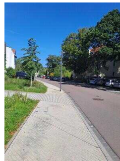
öffentliche Parkplätze an der Straße