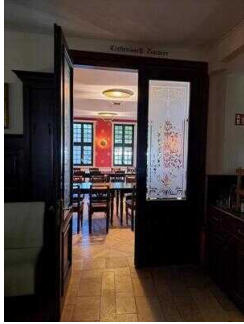
Tür vom Kamin- zum Eichendorff-Zimmer