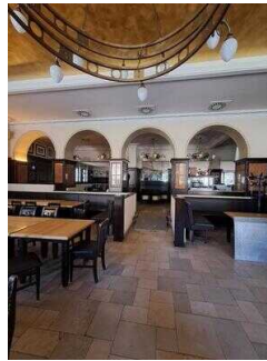
Stufen mit Anlegerampe zwischen Saal und übrigen Gasträumen