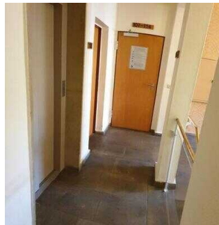
Wege auf den Fluren von Treppe/Aufzug zur Zimmerflurtür