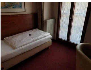
1. OG: Einzelzimmer 110