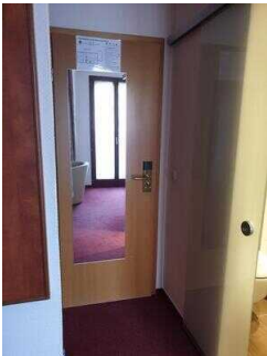
1. OG: Einzelzimmer 110