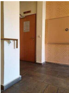
Wege auf den Fluren von Treppe/Aufzug zur Zimmerflurtür