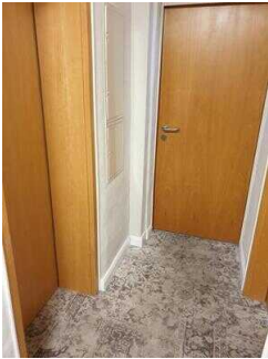
1. OG: Zimmerflur