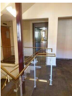
Wege auf den Fluren von Treppe/Aufzug zur Zimmerflurtür