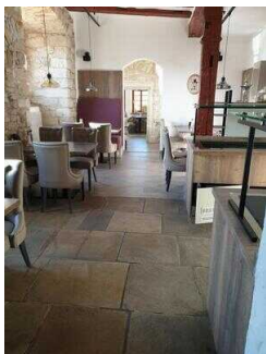
1. Raum mit Buffett