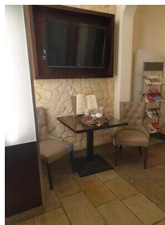
Sitzgelegenheiten im EG