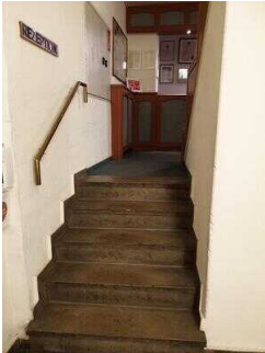
Stufen zur Rezeption