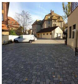
Weg vom Parkplatz zum Eingang