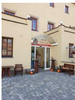
Ringhotel Jägerhof Weißenfels