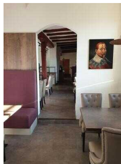
Stufe zwischen 1. und 2. Raum