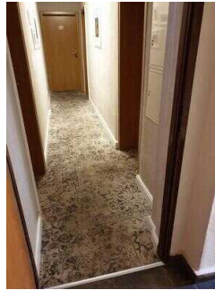
1. OG: Zimmerflur