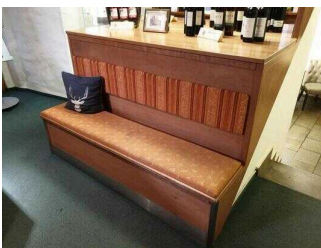
Hochparterre: Rezeption mit Sitzbank