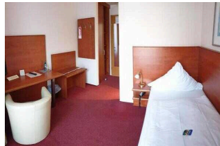
1. OG: Einzelzimmer 110