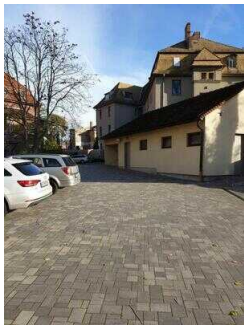
Parkplatz auf dem Hof