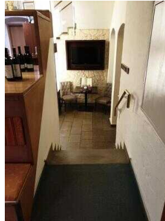
Stufen zur Rezeption