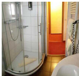
3. OG: Bad im Zimmer 307