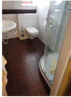
Bad im Zimmer 307