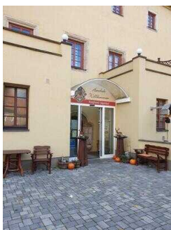
Weg vom Parkplatz zum Eingang