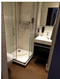
1. OG: Bad im Zimmer 110