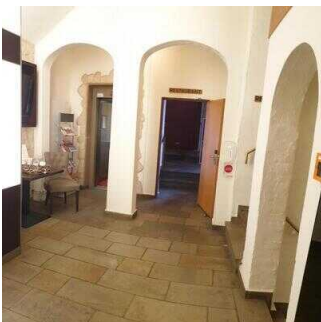
Lobby im Eingangsbereich