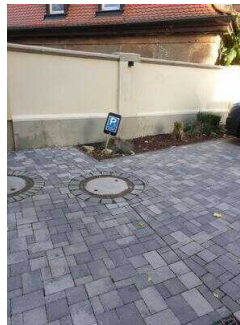
Parkplatz auf dem Hof