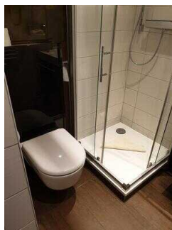
1. OG: Bad im Zimmer 110