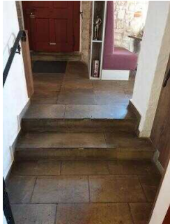
Stufen am Eingang Restaurant