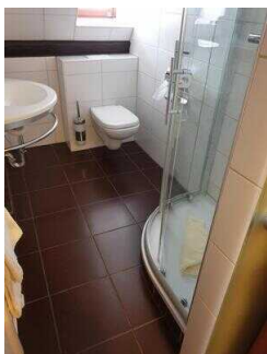
3. OG: Bad im Zimmer 307