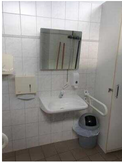
Öffentliches WC für Menschen mit Behinderungen