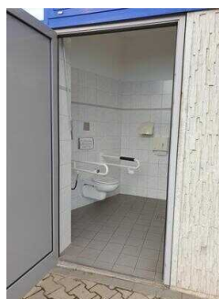
Eingang Öffentliches WC für Menschen mit Behinderung