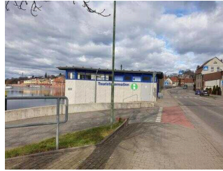
Weg vom Parkplatz zur Touristinformation