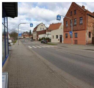
Weg von der Bushaltestelle zur Touristinformation