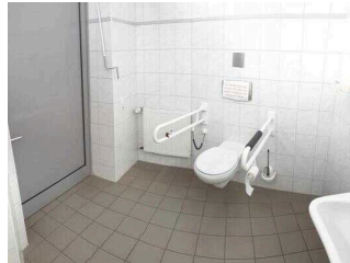
Öffentliches WC für Menschen mit Behinderungen