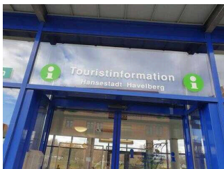
Tourist-Information Havelstadt Havelberg