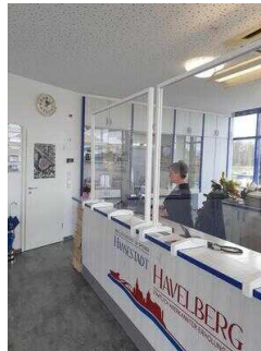
Counter mit Kasse