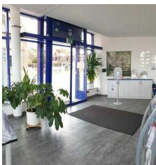
Tourist-Information Havelstadt Havelberg