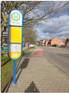
Bushaltestelle entgegengesetzte Richtung am Parkplatz