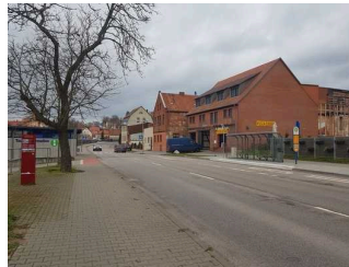
Weg außen vom Parkplatz zur Touristinformation