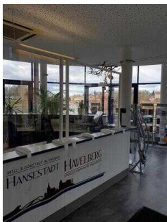
Counter mit Kasse