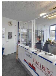
Tourist-Information Havelstadt Havelberg