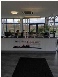
Counter mit Kasse