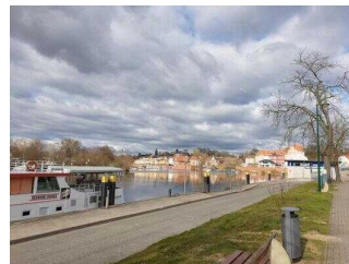
Blick auf die Havel und die Stadt