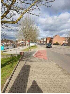
Weg vom Parkplatz zur Touristinformation