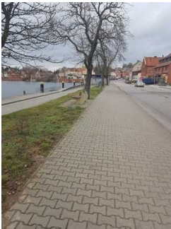
Weg außen vom Parkplatz zur Touristinformation