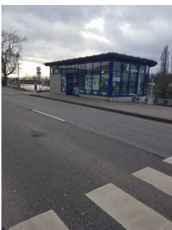
Weg außen von der Bushaltestelle zur Touristinformation