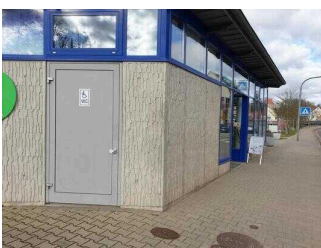
Eingang Öffentliches WC für Menschen mit Behinderung