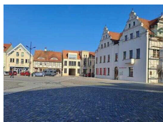
Marktplatz mit Rathaus