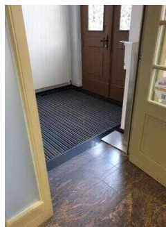
Entrance to the tourist information office (inside)