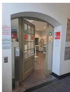
Eingang zur Tourist-Information