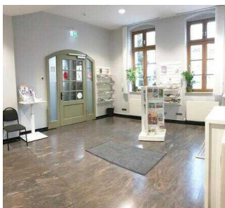
Eingang zur Tourist-Info (innen)