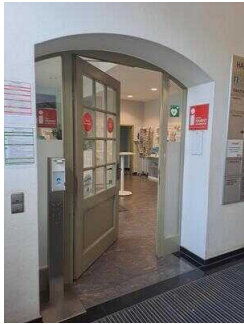
Eingang zur Tourist-Info (innen)