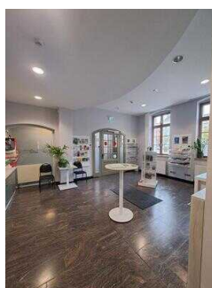
Tourist-Information Hansestadt Stendal