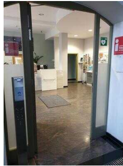
Eingang zur Tourist-Info (innen)