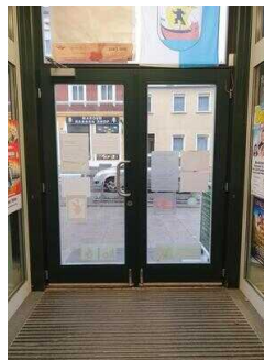
Windfang zwischen 1. und 2. Eingangstür