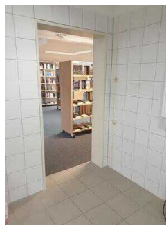
Öffentliches WC für Menschen mit Behinderung