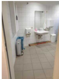
Öffentliches WC für Menschen mit Behinderung