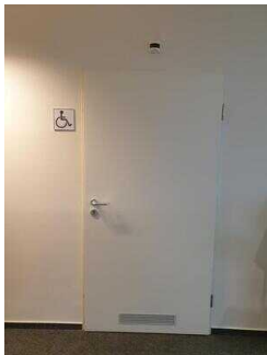
Öffentliches WC für Menschen mit Behinderung