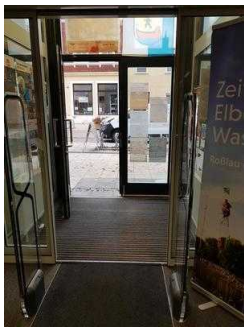
Windfang zwischen 1. und 2. Eingangstür