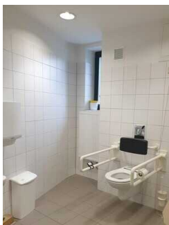
Öffentliches WC für Menschen mit Behinderung