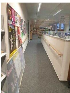
Rampe am Counter Richtung WC