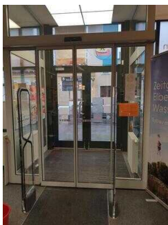
2. Eingangstür im Eingangsbereich