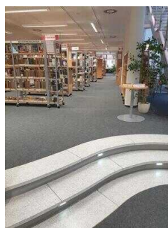
Blick vom Eingang/ Treppe zum WC (hinten links)